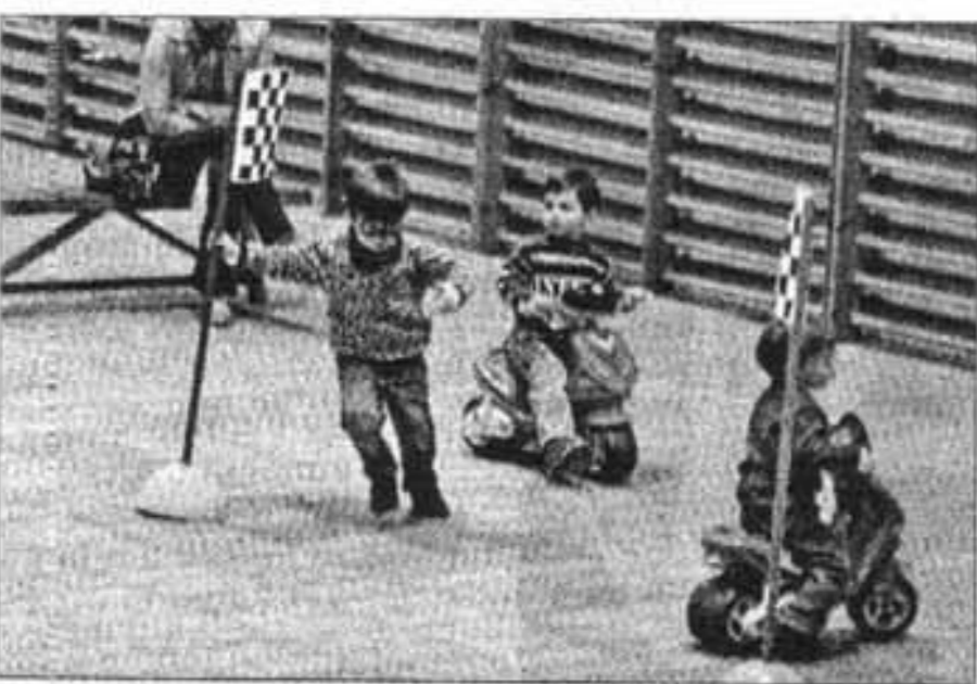
Los más pequeños fueron los que más disfrutaron de la pista

★ MAÓ MURÓ ANDRATX GETAFE SANT LLUÍS POLLENÇA CALVIÀ FERRERIES LAS PALMAS PETRA LLUCMAJOR BUNYOLA BARCELONA SANT JOAN DE LABRITJA SANTA EULÀRIA RAFELBUNYOL INCA MOSTOLES BÚGER L'HOSPITALET DE LLOBREGAT VILAFRANCA DE BONANY SANTA MARGALIDA ARTÀ VALLEMOSSA SINEU SANTA MARIA DEL CAMÍ VILLANUEVA DE LA CANADA LAS ROZAS SA POBLA ES CASTELL MARIA DE LA SALUT ALCÚDIA ES MERCADAL LLOSETA MANCOR DE LA VALL CONSELL MARRATXI COLLADO VILLALBA BINISSALEM SELVA SANT JOAN MANACOR VALENCIA PORRERES LLUBI ALAIOR ESPORLES PALMA FELANITX CASTELLO DE LA PLANA COSTITX ALGAIDA SANTA EUGENIA CIUTADELLA PUIGPUNYENT ES MIGJORN GRAN SES SALINES MONTUIRI SANTANYI ALBACETE MADRID SANT ANTONI DE PORTMANY SANT LLORENC DES CARDASSAR PINTO SENCELLES FORMENTERA CAMPANET SÓLLER GANDIA SANT JOSEP DE SA TALAIA ALARÓ EIVISSA CAMPOS ALCALÀ DE HENARES ALACANT DEIÀ SON SERVERA CAPDEPERA ALCORNENDAS