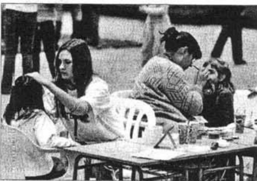
Los monitores colaboraban en los juegos de los niños