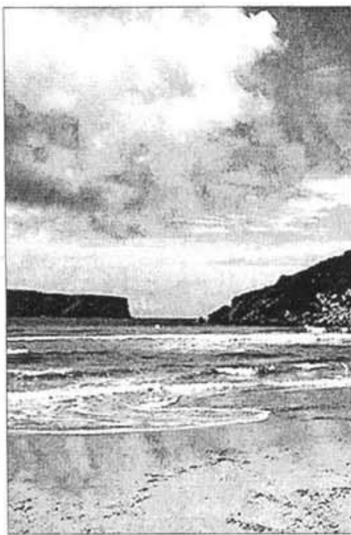
Platja de La Vall, a la costa nord.