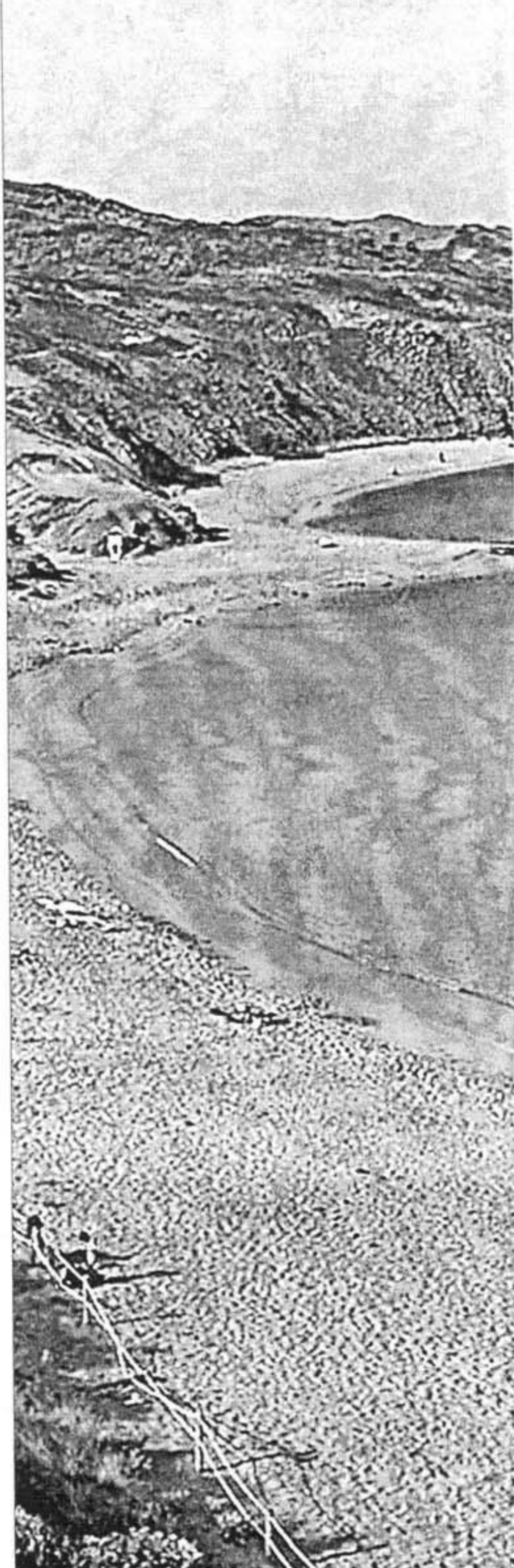
La platja de Cavalleria, al nord des Mercadal.