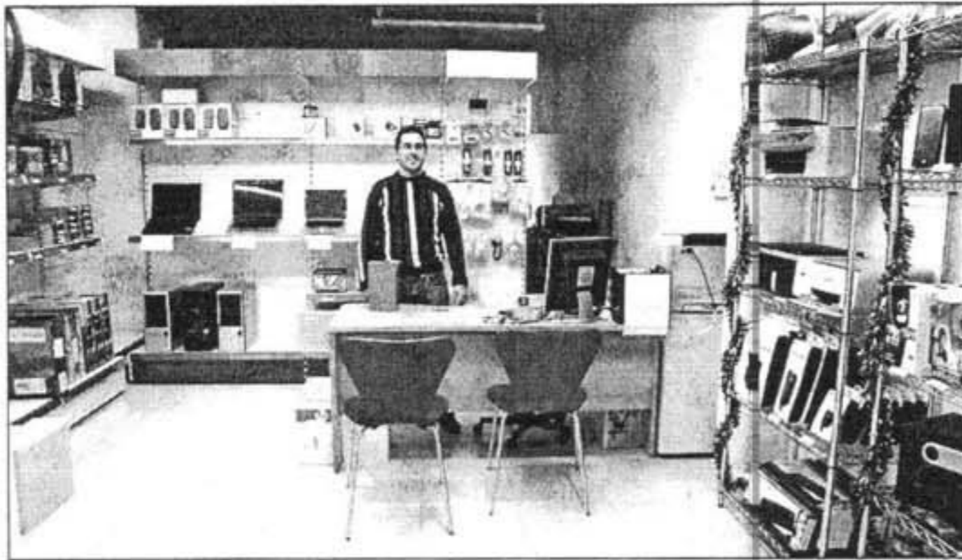
El responsable del nuevo establecimiento atiende personalmente a los clientes y usuarios.

empresas públicas ante el temor de que ocultaran un «agujero» financiero que pueda poner en peligro la estabilidad del propio Ejecutivo autonómico.