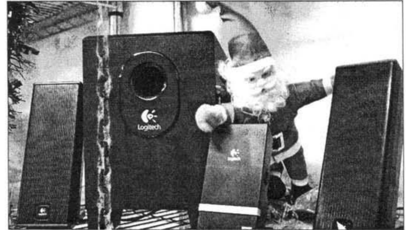
Ofrece toda clase de equipos, instalaciones y complementos informáticos.