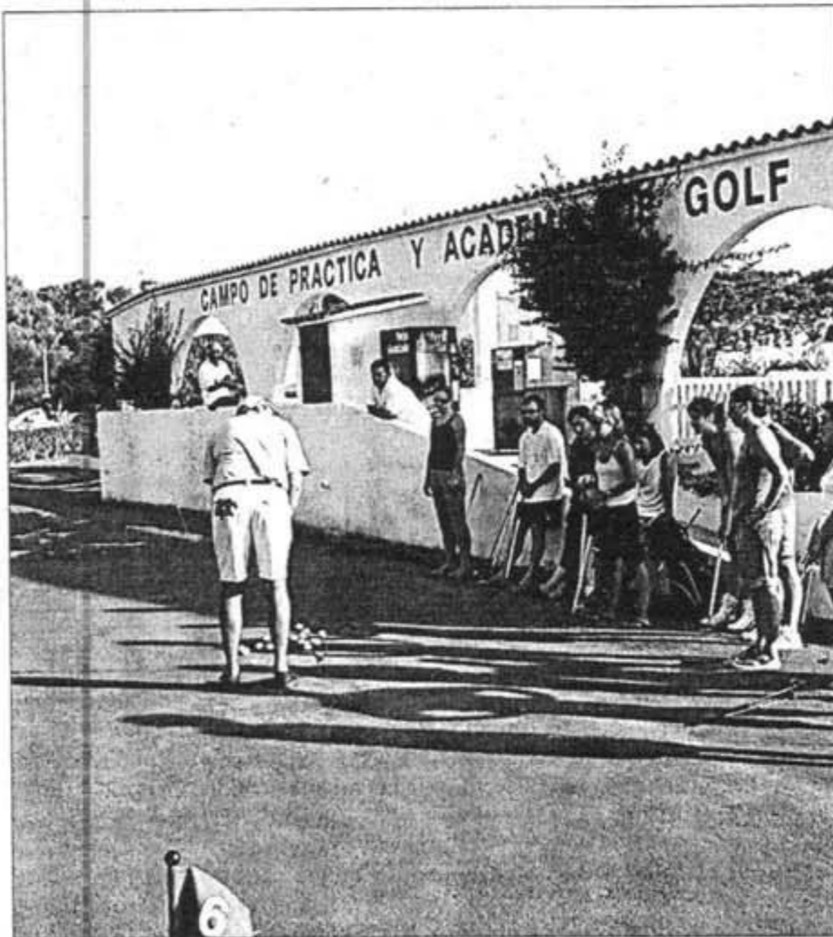
Se calcula que 5.300 turistas practican golf cada año en el campo de Son Parc.

El hotel, de cinco estrellas y 375 plazas, se edificará justo al lado del