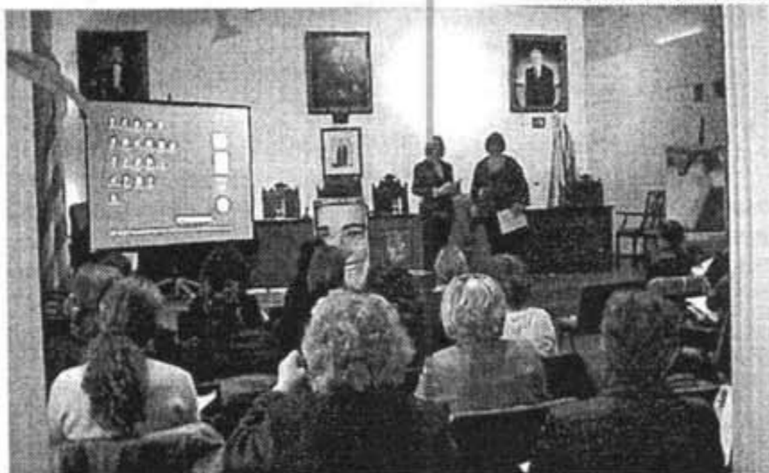
AYUNTAMIENTO ES CASTELL

Además, destacaron la poca especialización existente debido a que se cubre más de un tipo de necesidad asistencial. Por este motivo, señalaron la importancia de ir plantando un equipo y unas formas de trabajar multidisciplinarias