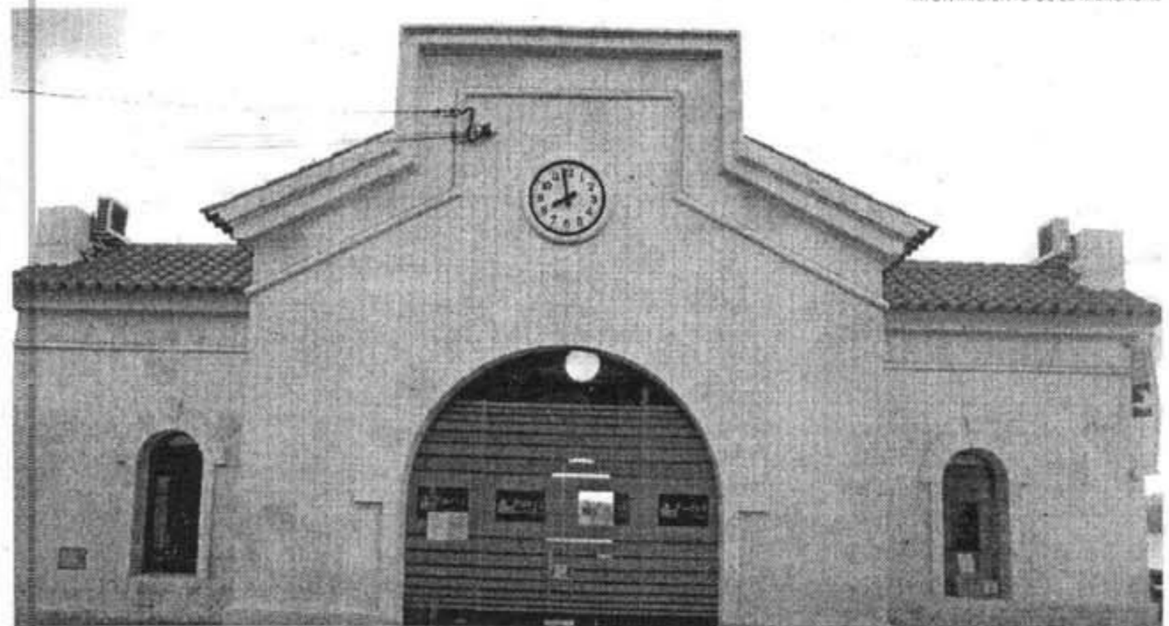
AYUNTAMIENTO DE ES MERCADAL

Los vecinos de Fornells y visitantes podrán disfrutar durante estas jornadas festivas y en adelante de la nueva imagen de la Casa des Contramestre.