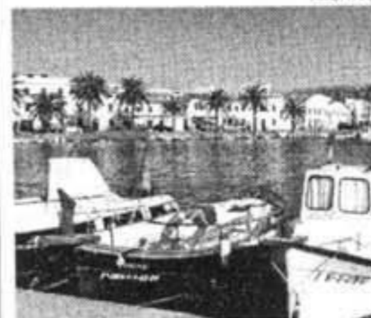
FORNELLS. Mejora del puerto

El partido popular lamenta que estas propuestas fueran rechazadas por el conjunto de partidos que