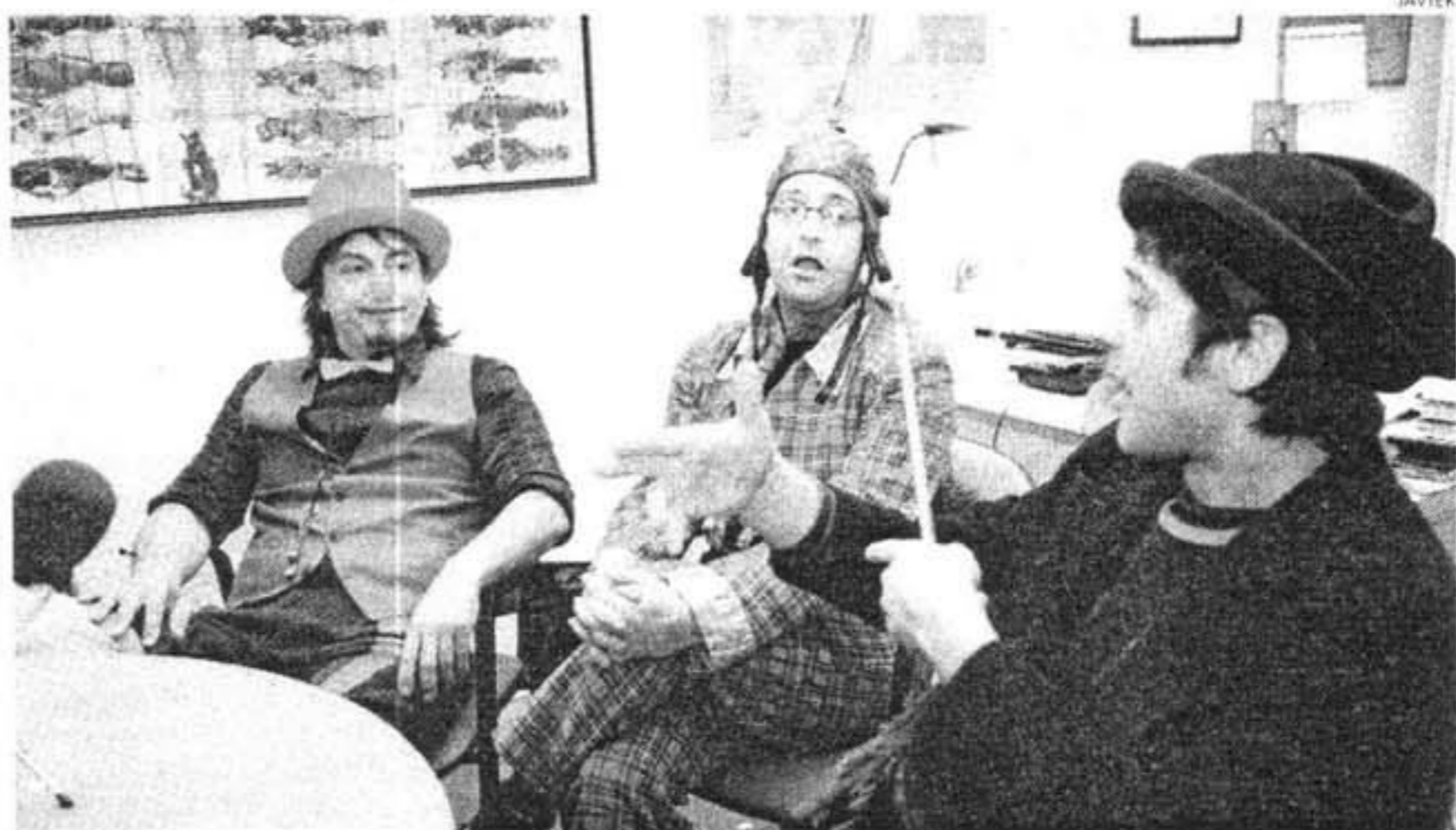
PRESENTACIÓN. Los responsables de Alaior, Maó y Es Mercadal posaron, divertidos, junto al payaso menorquín