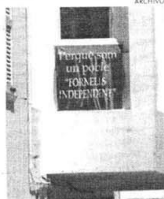
CARTEL. Reivindica la segregación