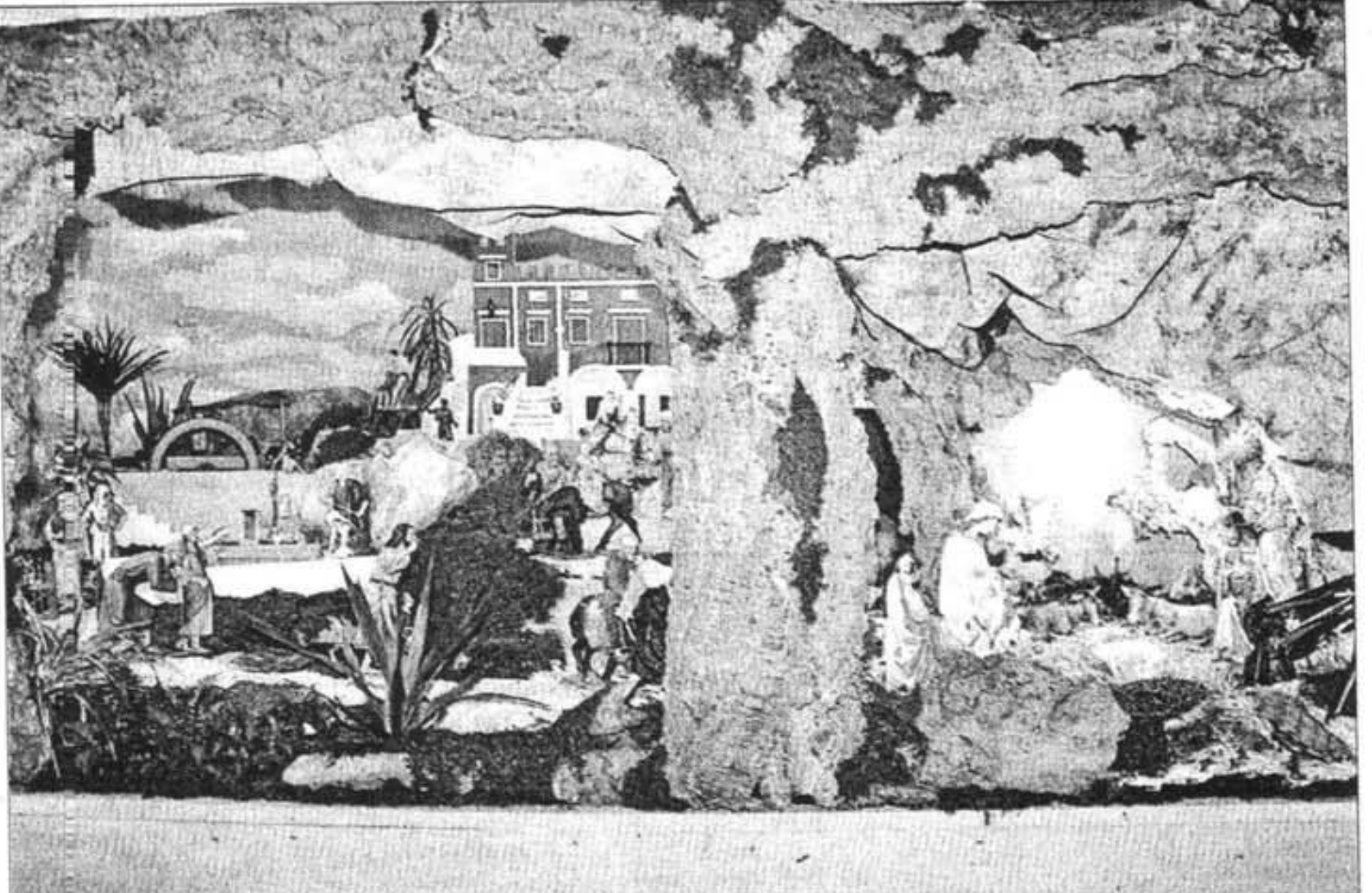
El belén de este año recrea el predio de Cala Tirant Nou y un hostel de Sant Climent con todo lujo de detalles.

Interesados y curiosos de toda la isla se desplazan en