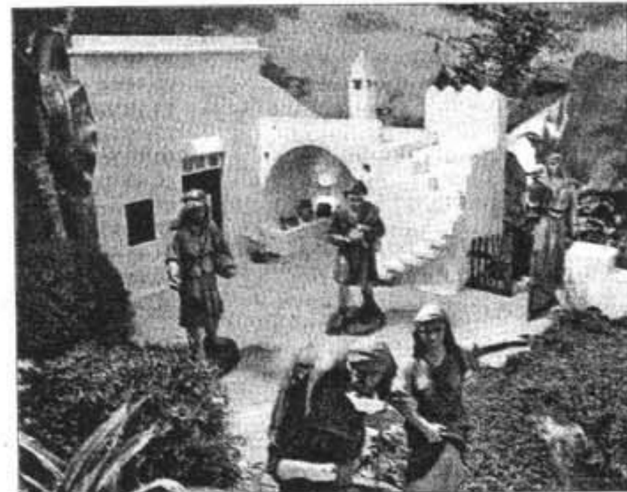
El precio de las figuras puede alcanzar los 700 euros.

Este tipo de belenes constituyen toda una inversión económica, ya que el precio de las figuras oscila entre