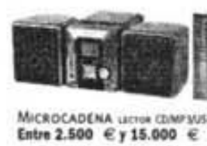
MICROCADENA LECTOR COMPACTA Entre 2.500 € y 15.000 €