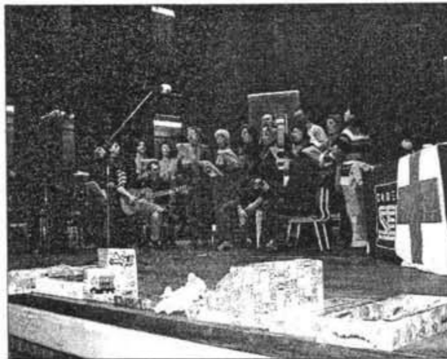
El Coro Rociero interpretó villancicos típicos andaluces.