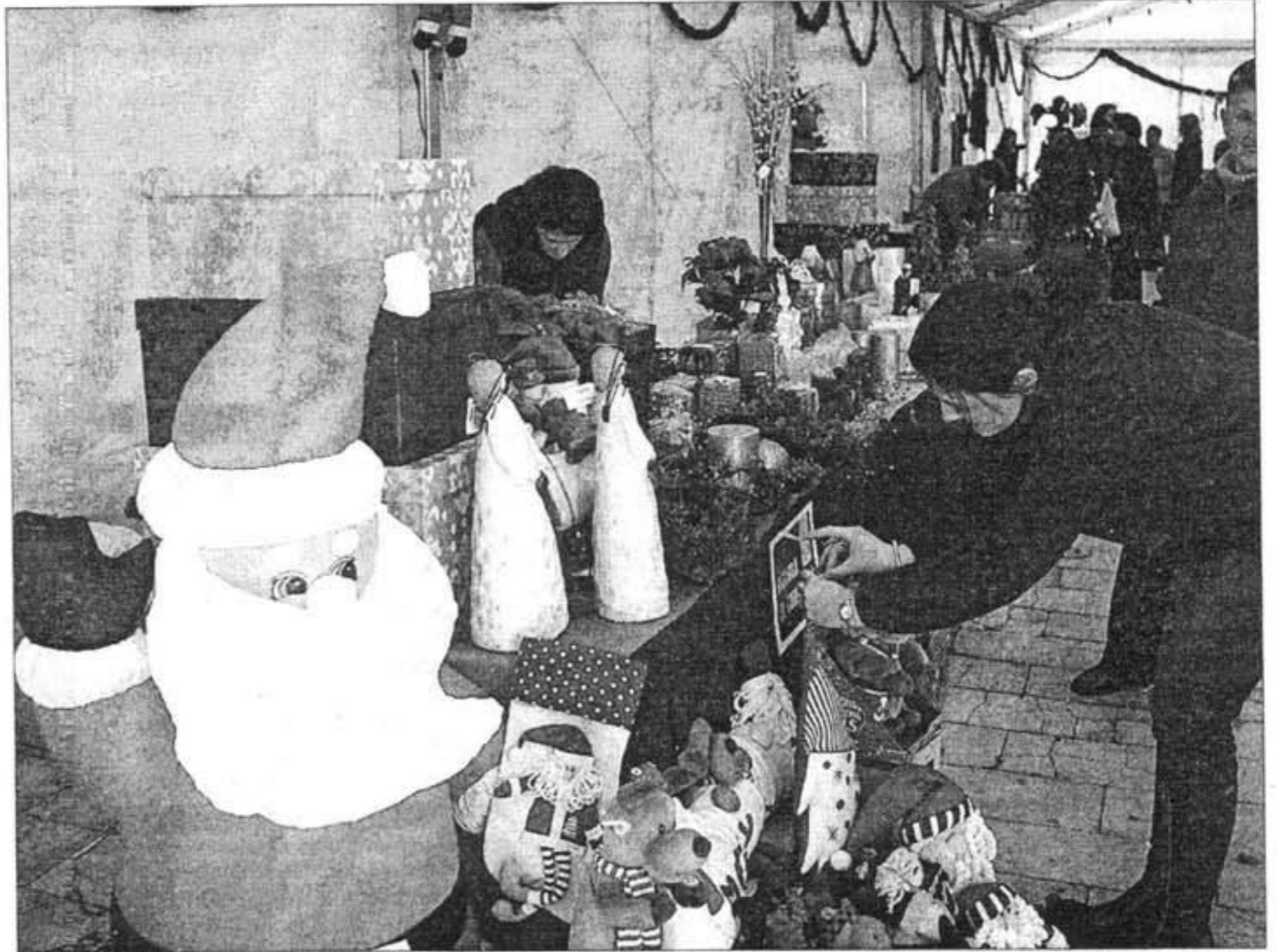
Los Enderetes expusieron multitud de artículos de ornamentación para estas fechas navideñas.