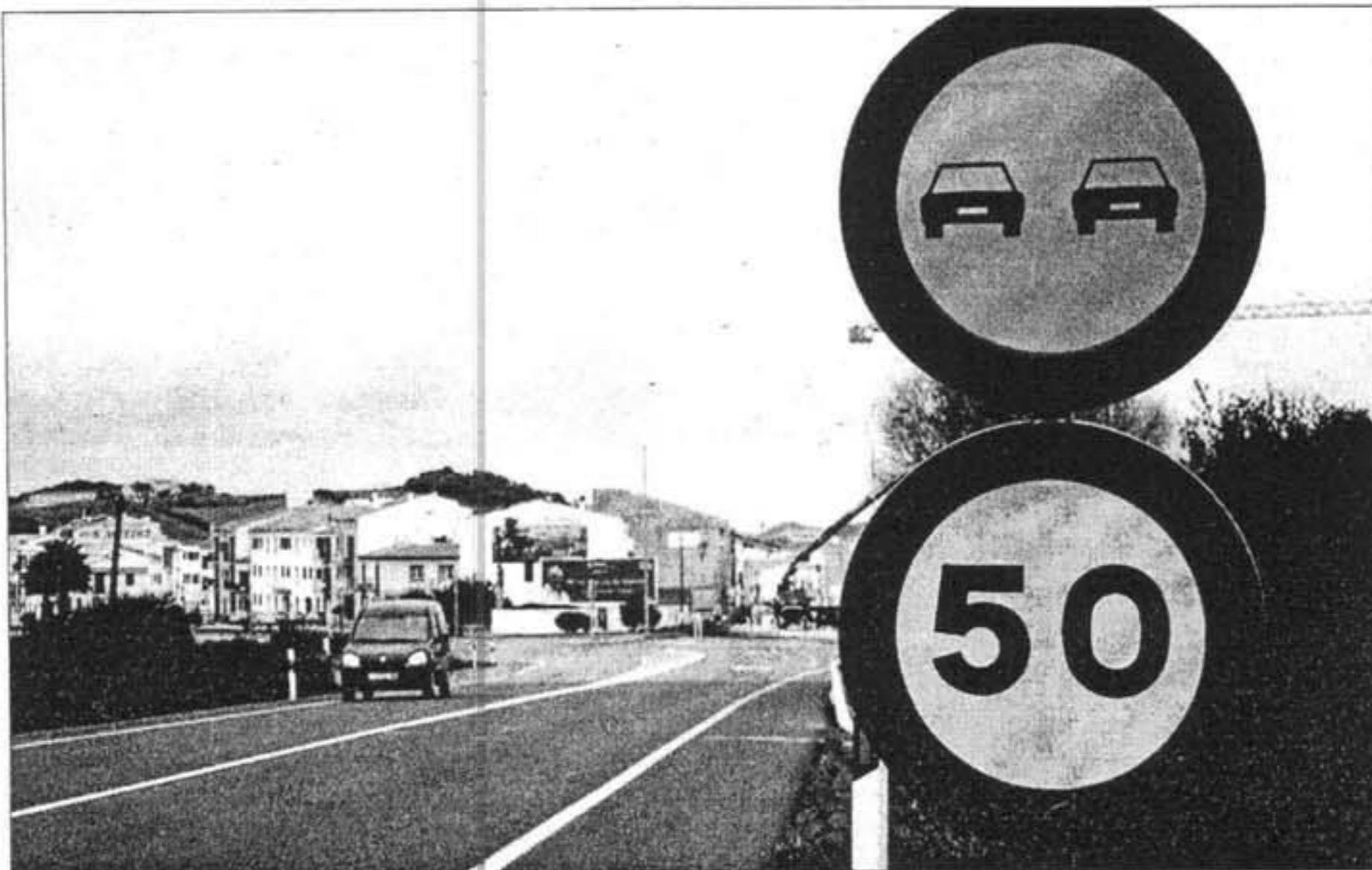
La señal que recuerda la velocidad máxima en la travesía de Es Mercadal es poco respetada.

En un futuro próximo, la Dirección General de Tráfico tiene previsto instalar un segundo radar fijo en la isla que se ubicaría en la carretera de Maó a Fornells. Este dispositivo se suma al radar móvil, oculto en un vehículo, de que dispone la Guardia Civil de Tráfico en Menorca y los radares, también móviles, con que reciente-