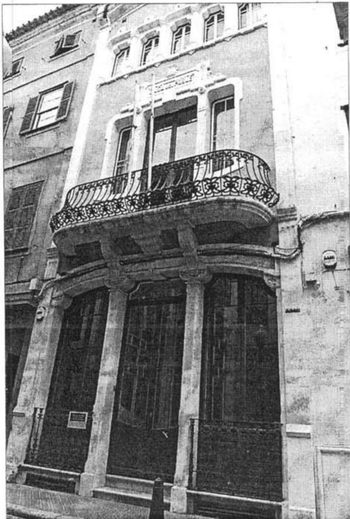
● Arquitectura reconocida. Once edificios de Menorca han sido incluidos en un catálogo que destaca los mejores de España en el siglo XX. Entre ellos, la Casa del Poble de Maó. ▶ CONTRAPORTADA PÁGINA 48