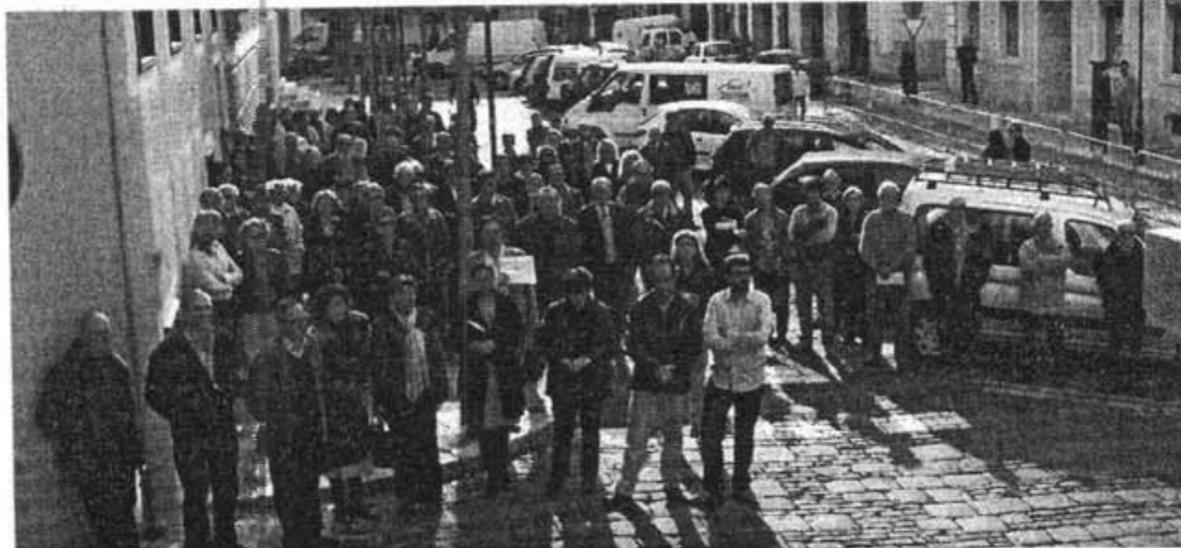
MAÓ. El silencio en la plaza Constitución se vio perturbado por un generador

quiso subrayar la importancia de salir a la calle para mostrar el rechazo de la ciudadanía ante los atentados.