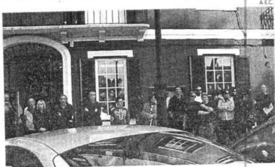
ES CASTELL. La alcaldesa encabezó el acto

AL MEDIODÍA, A LAS PUERTAS DE AYUNTAMIENTOS Y DE SEDES DEL CONSELL SE COMPARTIERON CINCO MINUTOS DE SILENCIO