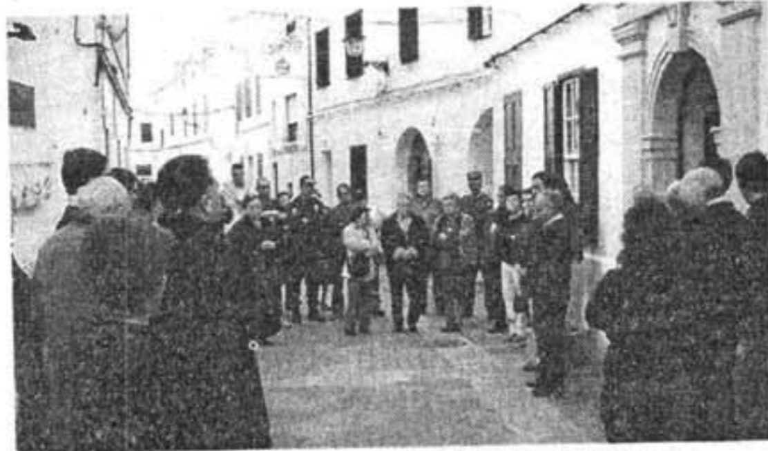
ES MERCADAL. Un policía y un guardia civil, entre los presentes