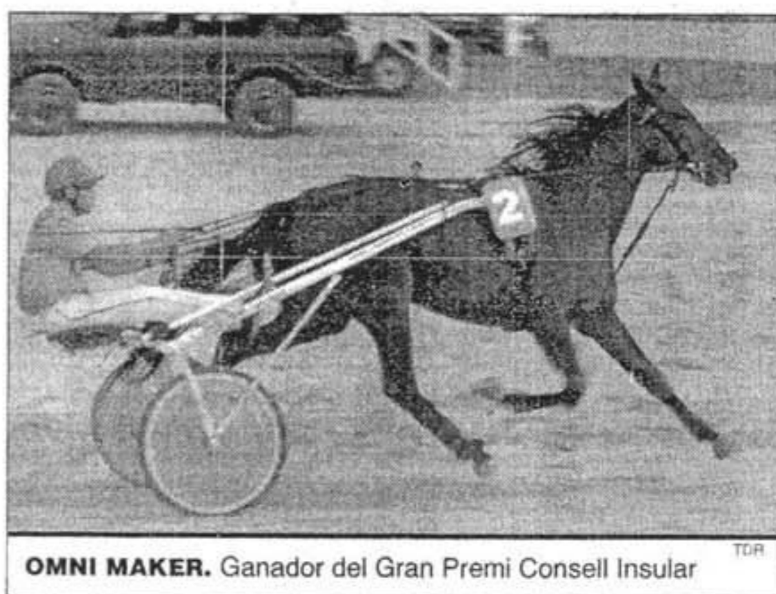
OMNI MAKER. Ganador del Gran Premi Consell Insular

Los caballos de segunda categoría protagonizaron la carrera menos vistosa de la reunión. Tras dos polémicas salidas nu-