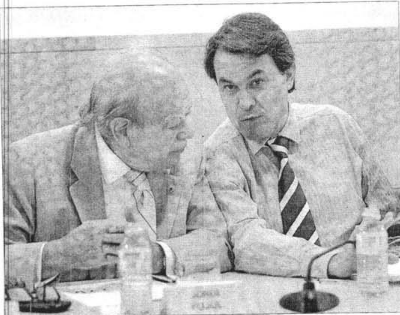
Jordi Pujol considera a Artur Mas su «delfín político» en Convergència Democràtica.

Las gestiones de Llorenç Brondo para contar con la participación del ex presidente catalán en este acto dieron comienzo el 2006, con la intención de que pu-