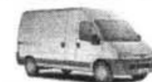
PEUGEOT BOXER CARGO

PRECIOS ESPECIALES Y OFERTAS A PARTICULARES Y EMPRESAS, INSTITUCIONES, COLEGIOS, COLECTIVOS