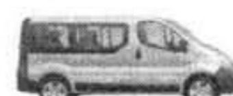
OPEL VIVARO 9P