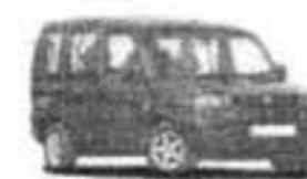
FIAT DOBLO 7P