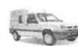
RENAULT EXPRESS MIXTA

Información y reservas: 971 354 244 · Plaza España, 13 · Maó · autosvalls@autosvalls.com