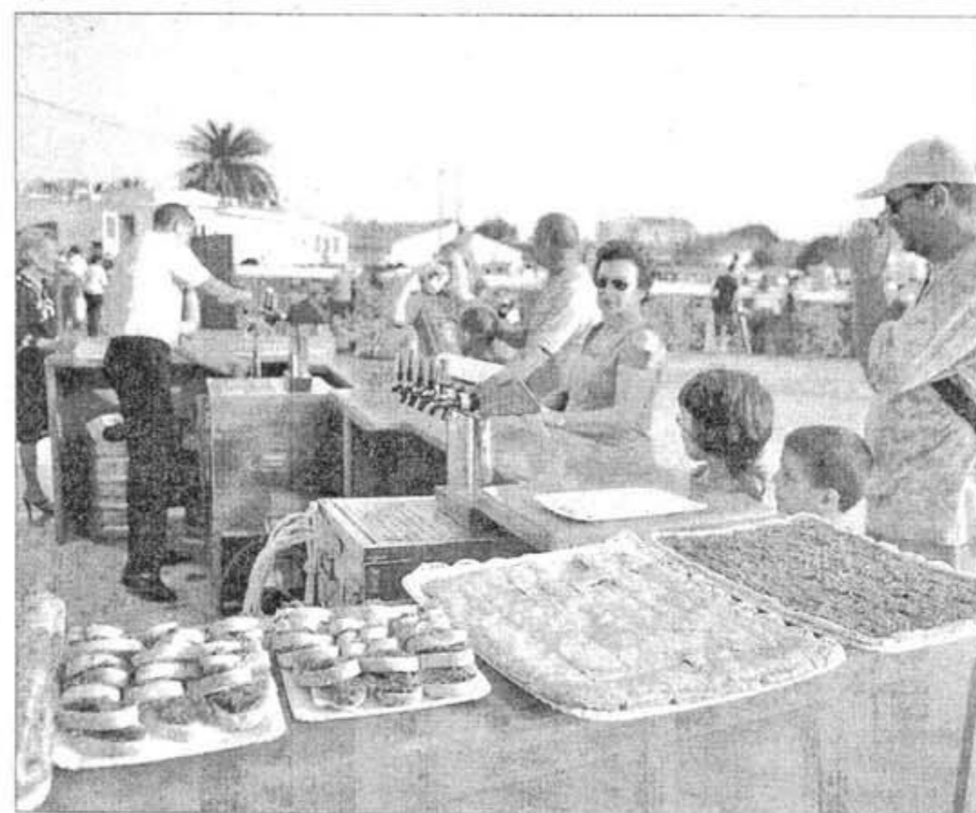
La venta de 'coques' y bebida contribuyó a la recaudación de fondos.