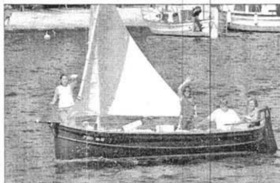
Medio centenar de personas acudieron al encuentro.