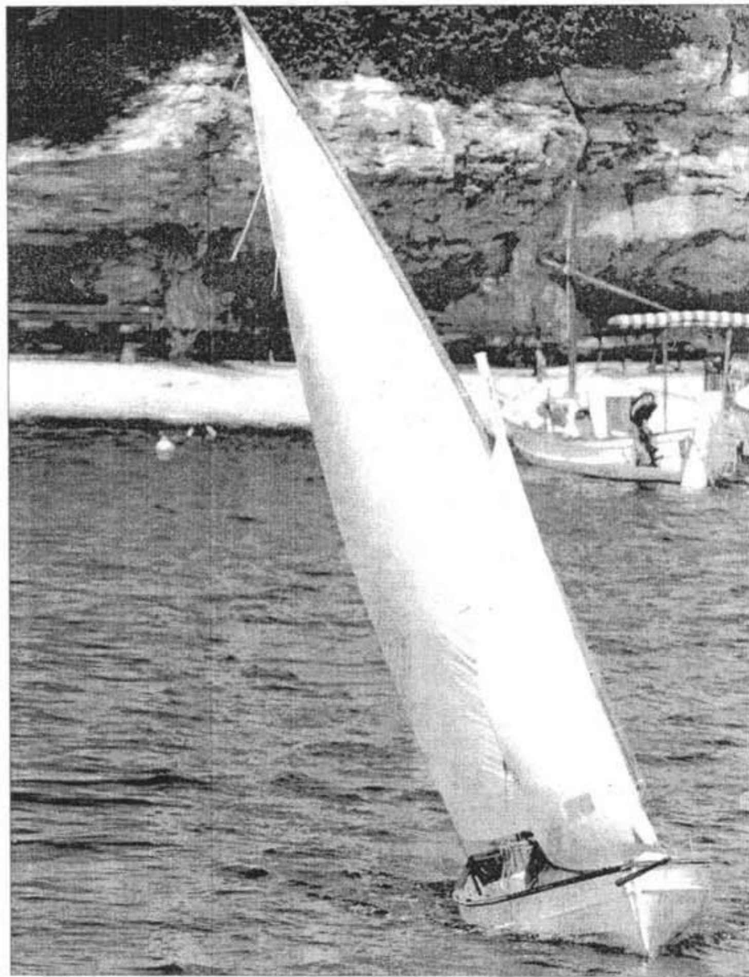
Las velas desplegadas de los 'bots' y 'llaüts' dejaron estampas de gran belleza.

invierno, los Amics de la Mar centrarán su actividad en la restauración del bot