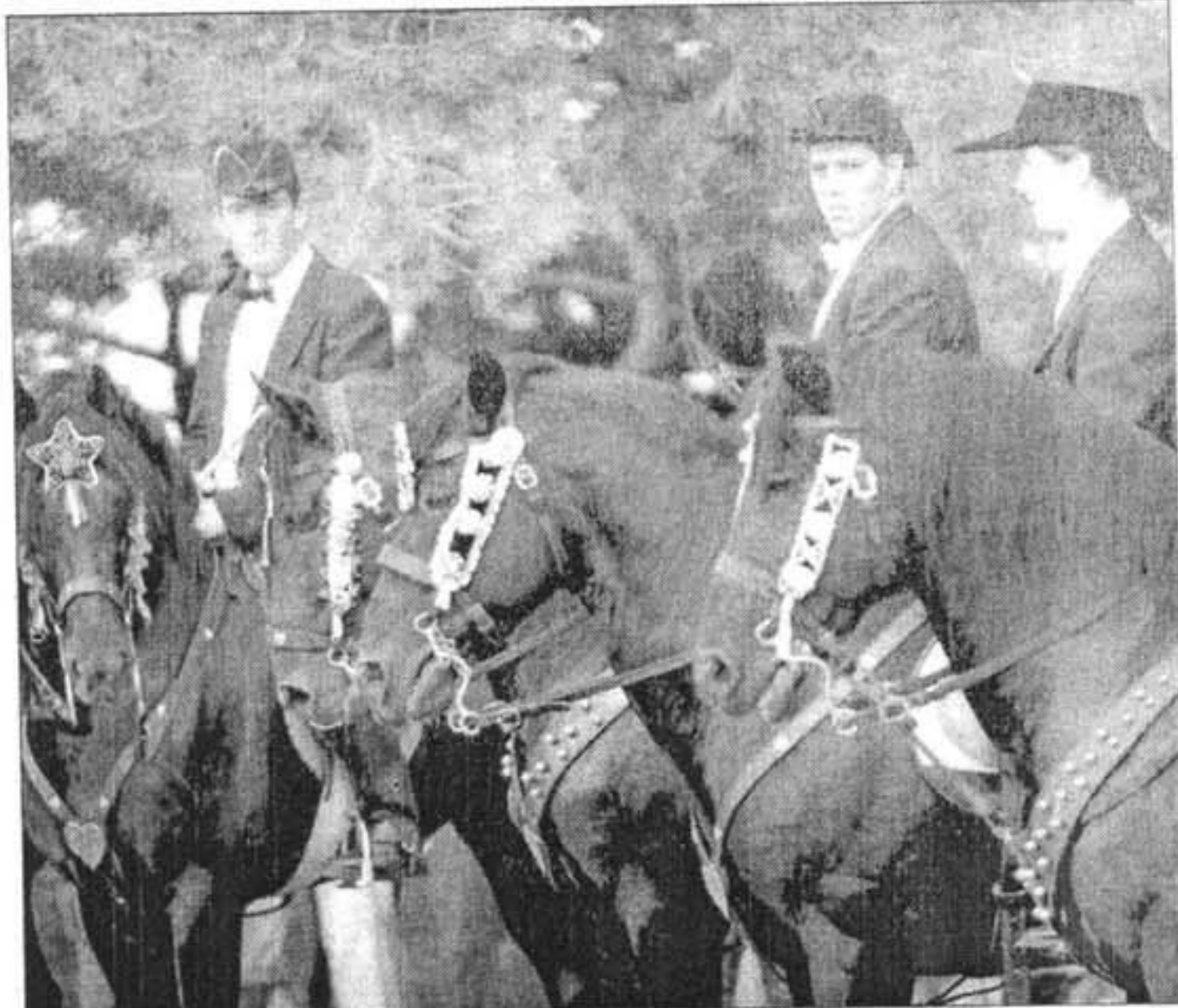
CAIXERS. Una de les belles imatges que deixa la festa