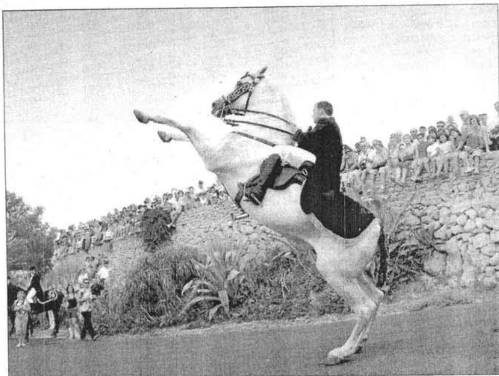
JALEO. Els genets feren dues voltes de jaleo i una de canyes a l'aparcament del santuari

Sant Nicolau ha tancat les portes de les festes patronals en clau, tot dient: "Fins l'any que ve". ■