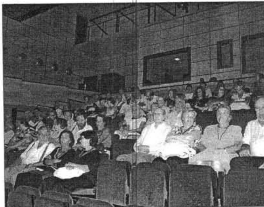
Asistieron una gran cantidad de melómanos, que disfrutaron recordando la figura irrepitible de Luciano Pavarotti.