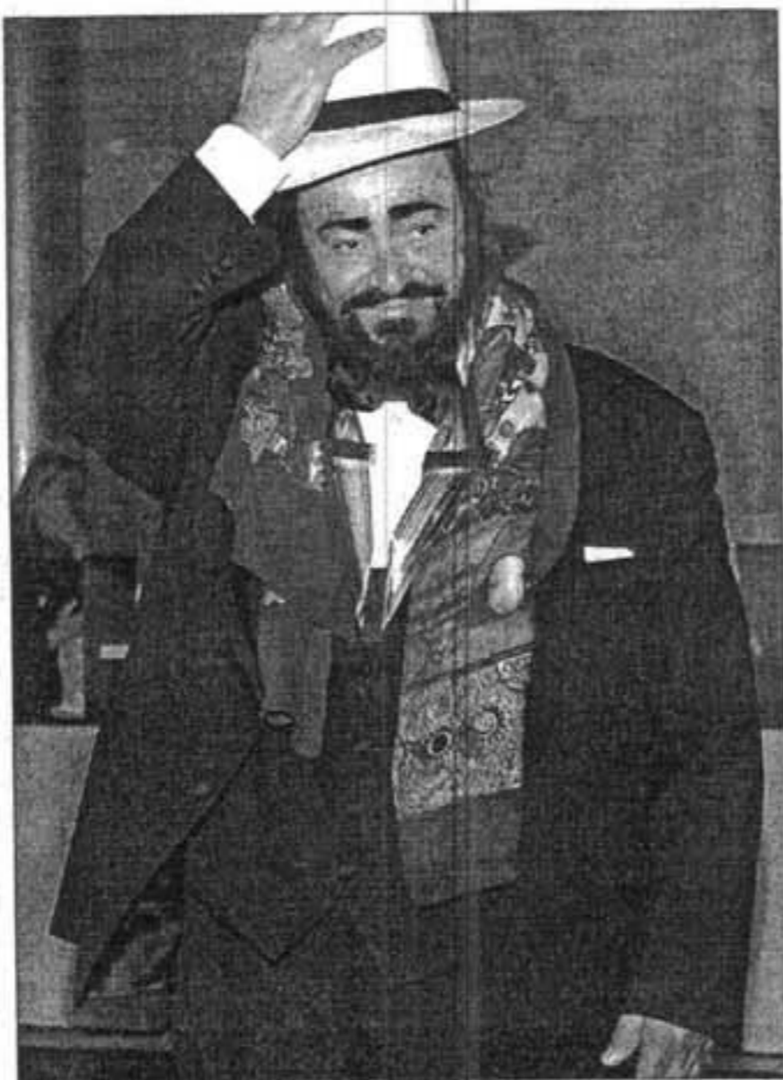
El mundo de la música ha perdido a una figura única de la ópera.