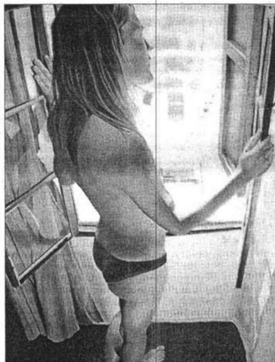
La mirada moderna, del pintor Josep Moncada.