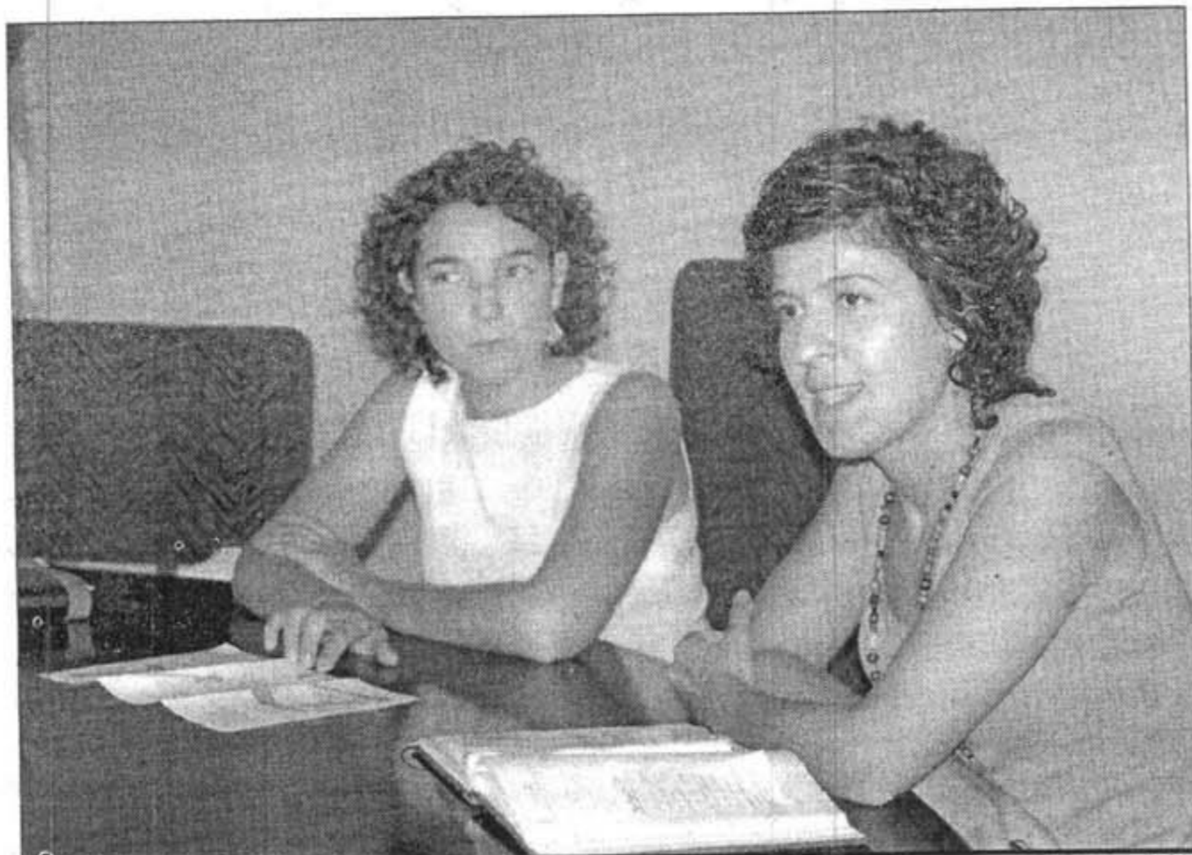
REGIDORA I DIRECTORA. Volen que continui la millora en nombre d'alumnes i en qualitat docent