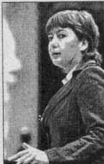
Con la Diada a cuestas.

➔ ETA PUEDE matar en cualquier momento. No obstante, la detención de 26 de sus delincuentes en los últimos meses y en especial el golpe del pasado fin de semana, en el que ha caído