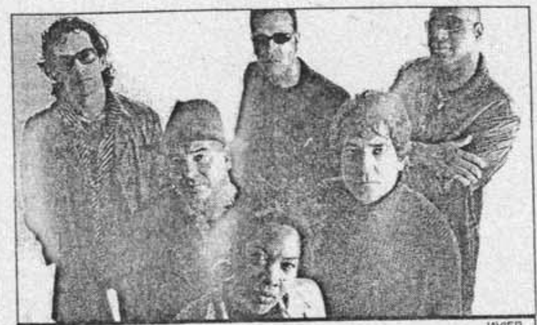
STIGMATO. El grupo actúa esta noche en el Akelarre