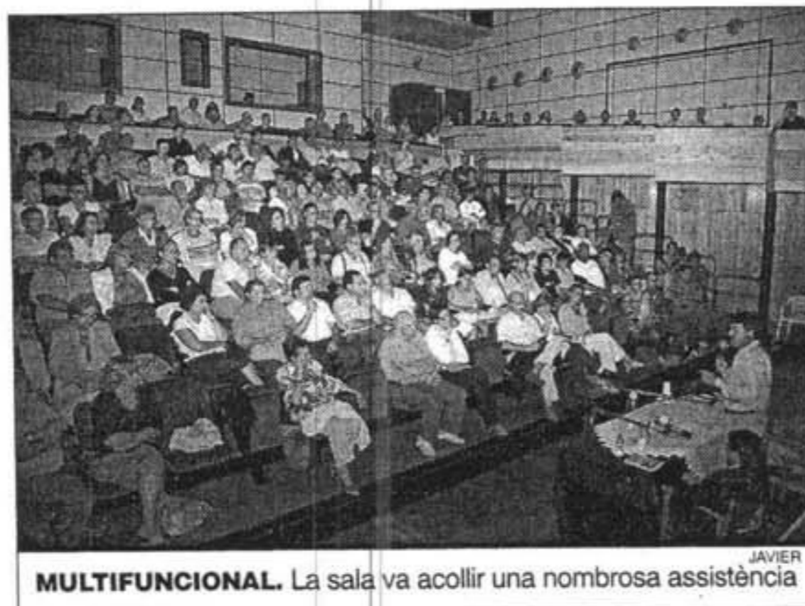
MULTIFUNCIONAL. La sala va acollir una nombrosa assistència

vinculat amb l'Illa des de fa més de 40 anys estiuant a Fornells.