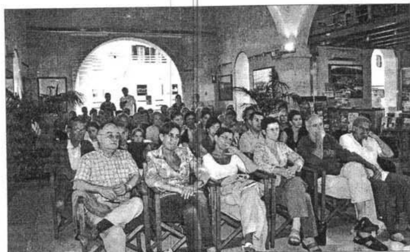
El público aprendió consejos prácticos para resolver sus problemas de comunicación personal.

dades», cuenta. ¿Pero cuál es la receta de la comunicación personal? El autor lo explica: En primer lugar, profundizar en la comunicación ya que cuesta mucho hablar de nuestros sentimientos; segundo, saber administrar la confianza, es decir, escoger bien a quién y cuándo lo contamos; tercero, desterrar la crítica y sustituirla por observaciones; cuarto, aprender maneras de abordar los conflictos para evitar que las conversaciones acaben en discusiones, y quinto, fijarnos más en lo que nos une antes que en lo que nos separa.