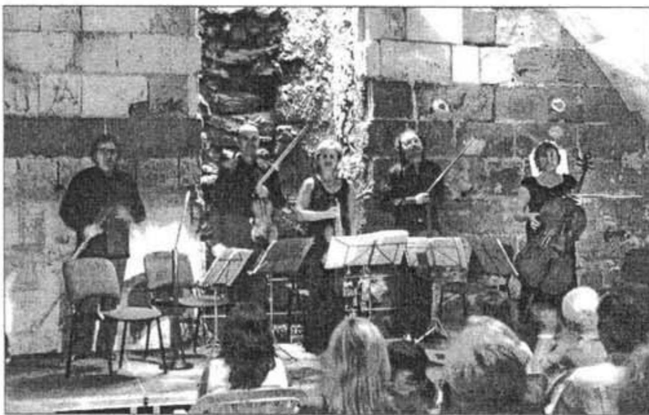
El castillo se llenó con los sonidos de autores tan conocidos como Mozart y Boccherini

La primera de estas, de la etapa preromántica, fue una estupenda introducción para el resto del programa, ya que su muy acertada interpretación permitió ya atisbar la gran calidad del programa que se ofrecía. La obra de Boccherini, por su parte, trajo sensualidad e intensidad a la velada debido a