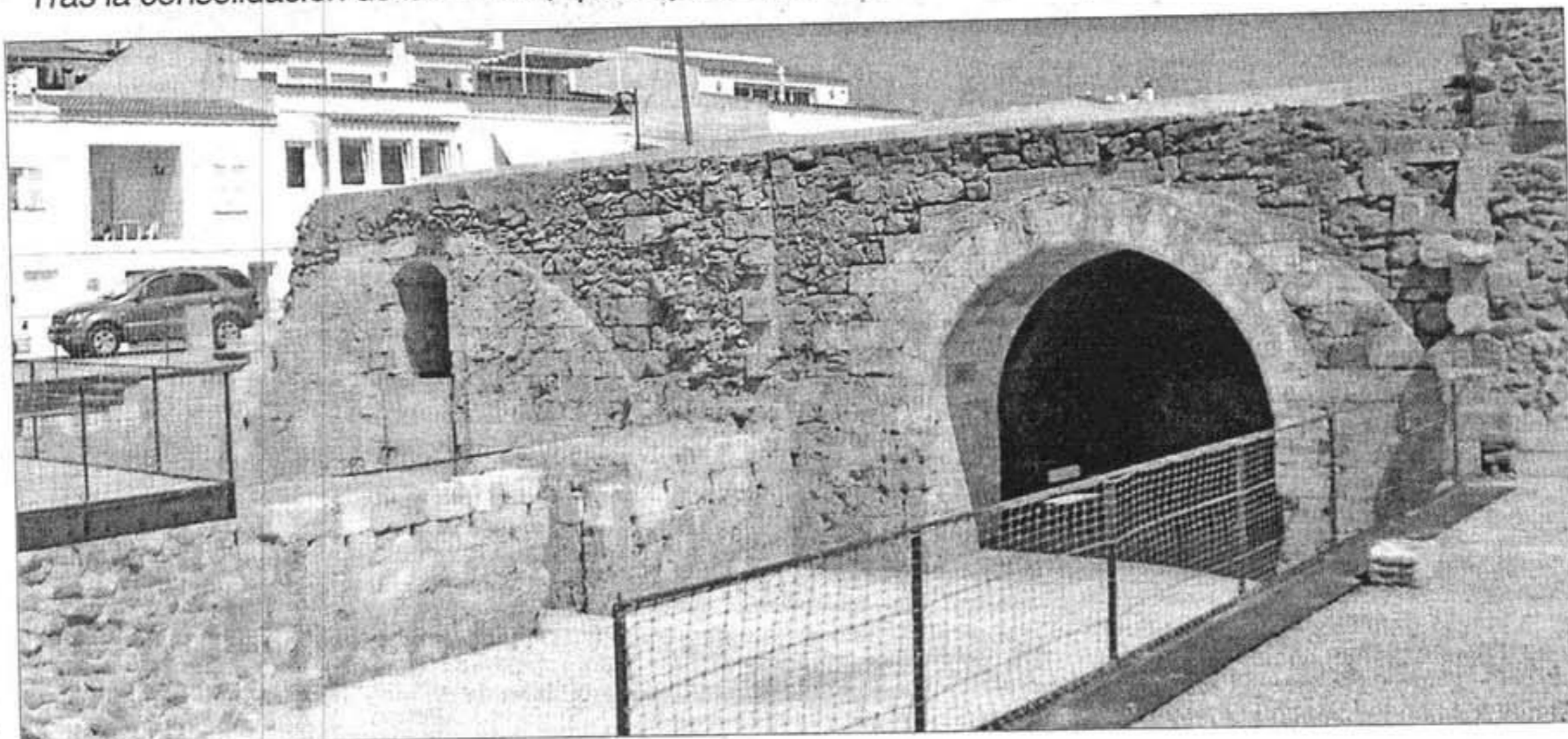
Las obras de consolidación de las ruinas del castillo comenzaron en 2004 con la ayuda económica del Govern balear y del Consell.

Tras la consolidación de las ruinas, queda poco más de un mes para que estén finalizadas las obras