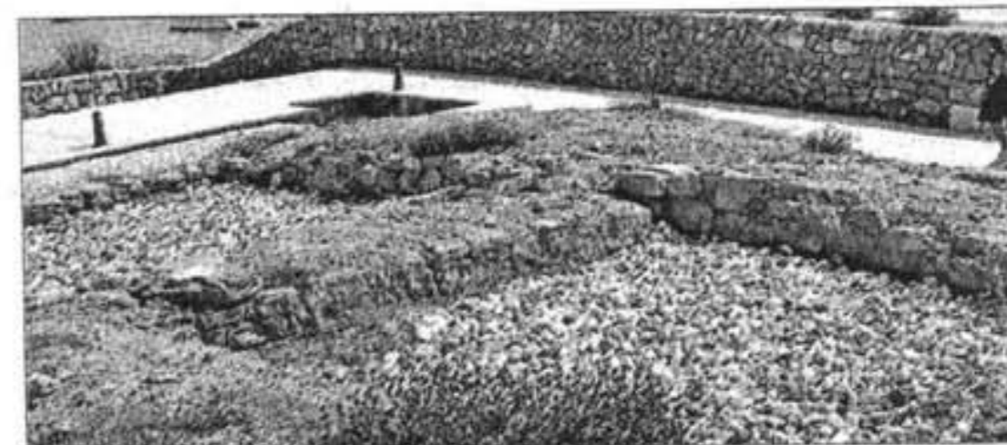
En la parte superior de las salas se puede pasear por un recorrido.