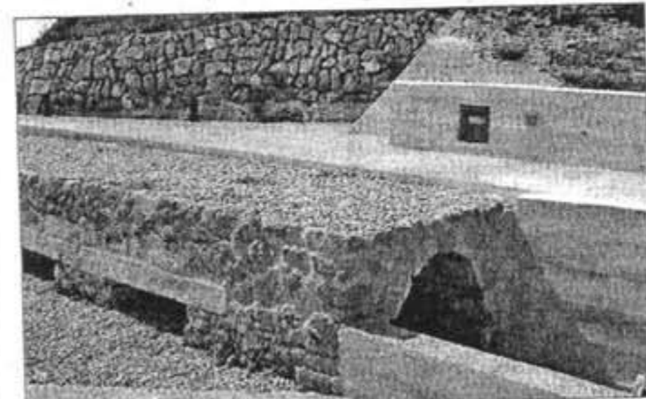
Con una visita se pueden observar muchos detalles.

Una delegación del Ajuntament de Es Mercadal, del Consell y del Govern visitan el espacio renovado de la antigua fortificación militar.