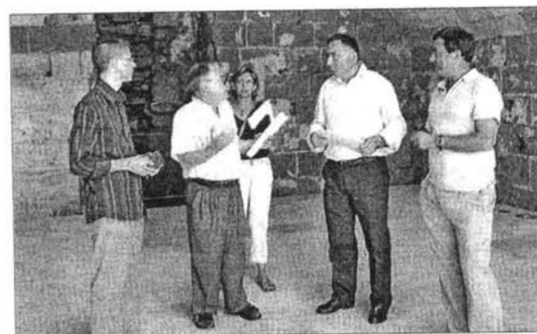
Los representantes políticos observaron la consolidación de las obras.