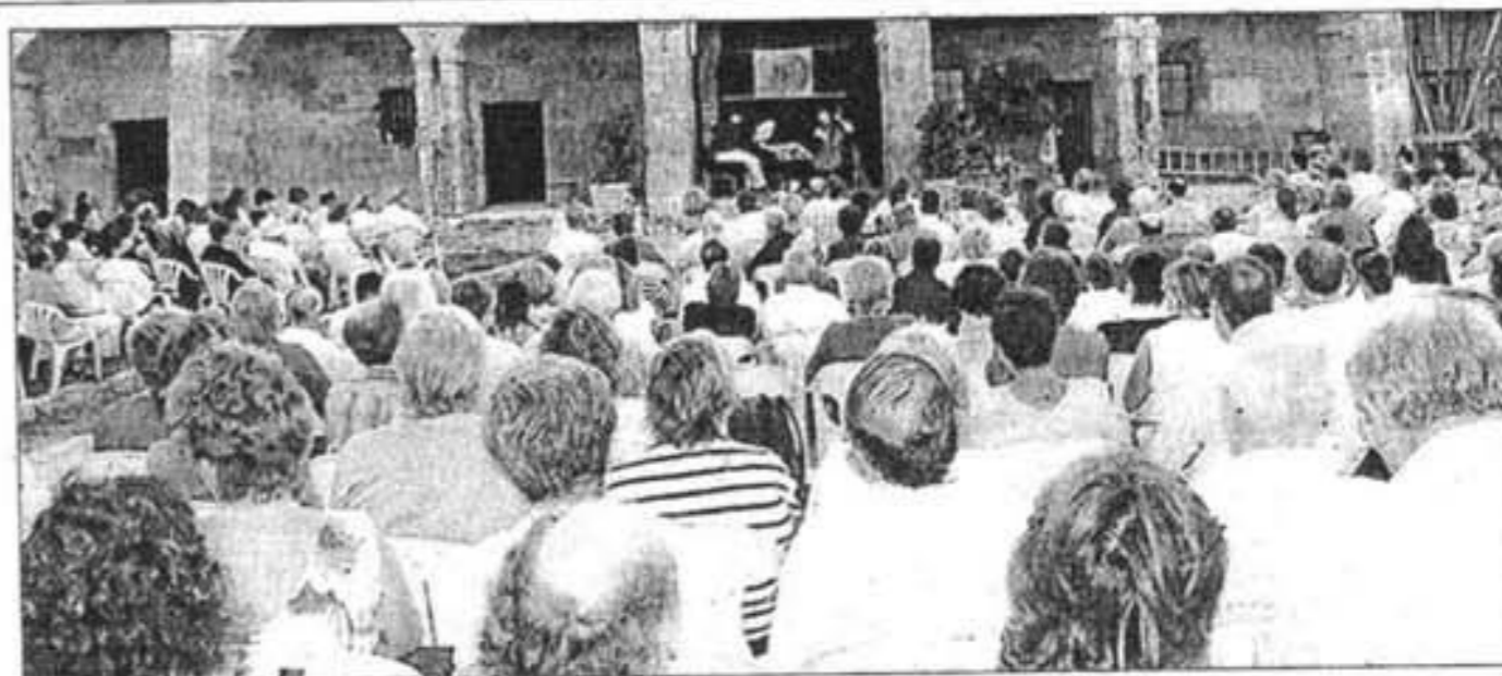
Numeroso público presenció el acto en la Isla del Rei.

El público asistente merece una mención especial, ya que comprendió las dificultades de los intérpretes en interpretar en un espacio poco favorable. Por otra parte, cabe destacar los numerosos donativos que se recogieron a lo largo de la jornada sabatina.