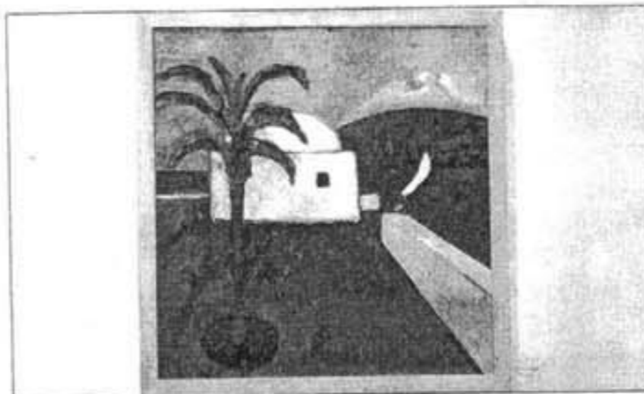
Paisaje de Fornells, entre la realidad y la interpretación.