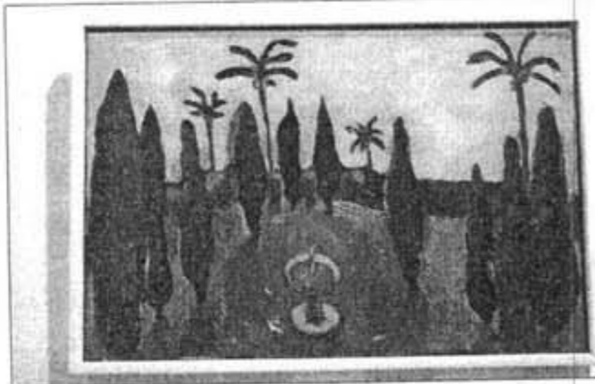
Jardines vibrantes ordenados por sugerente cromatismo.