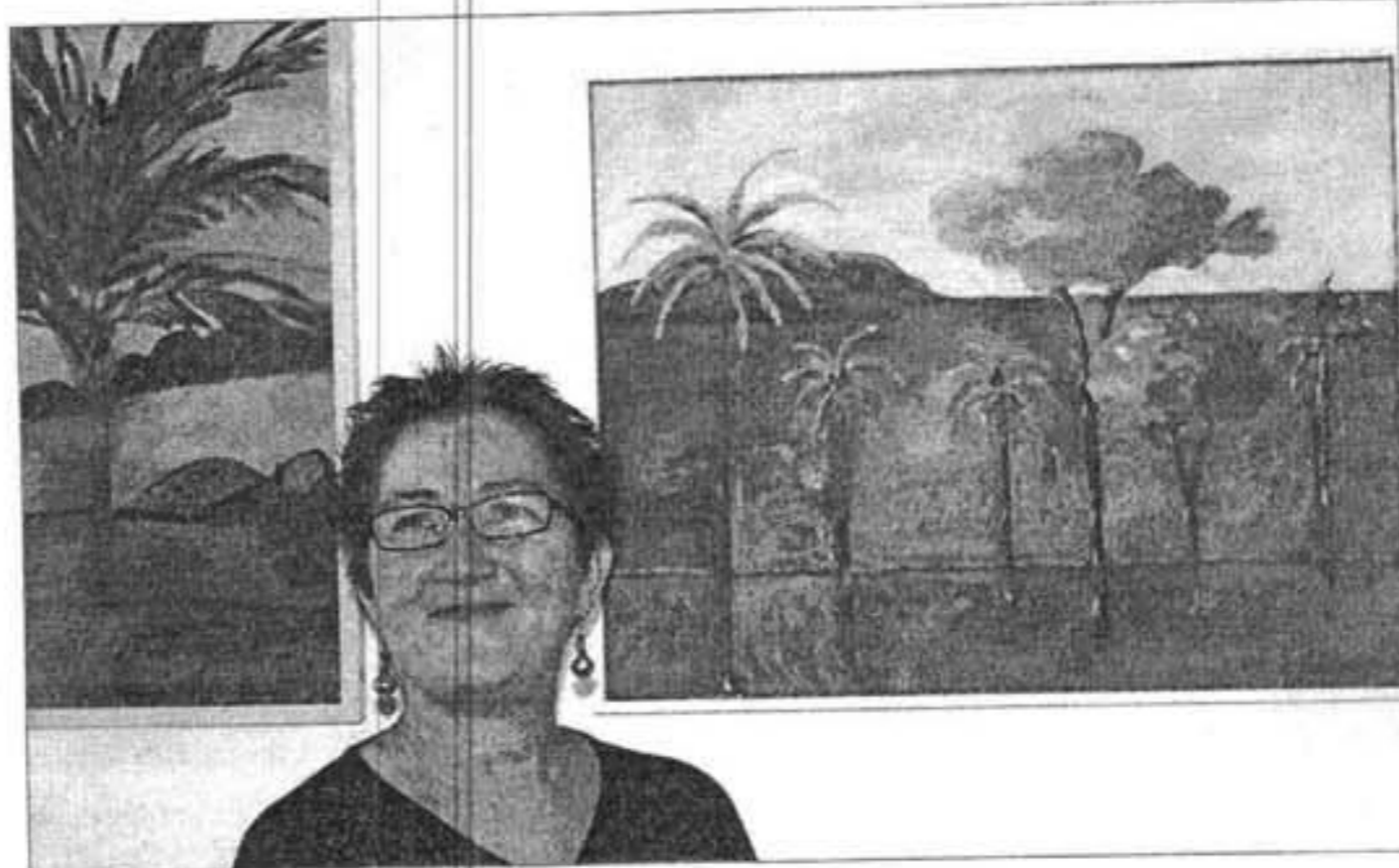
La autora con una de sus obras representativa, espacios de color y árboles esbeltos.

Siguiendo la fuerza de aquellos 'fauvistas' franceses, el mensaje está en ese color casi sólido pero de múltiples sugerencias. Las sombras no son negras, y va forzando la identidad cromática de cielos, árboles y tierras hasta quedarse con su mensaje más intuitivo.