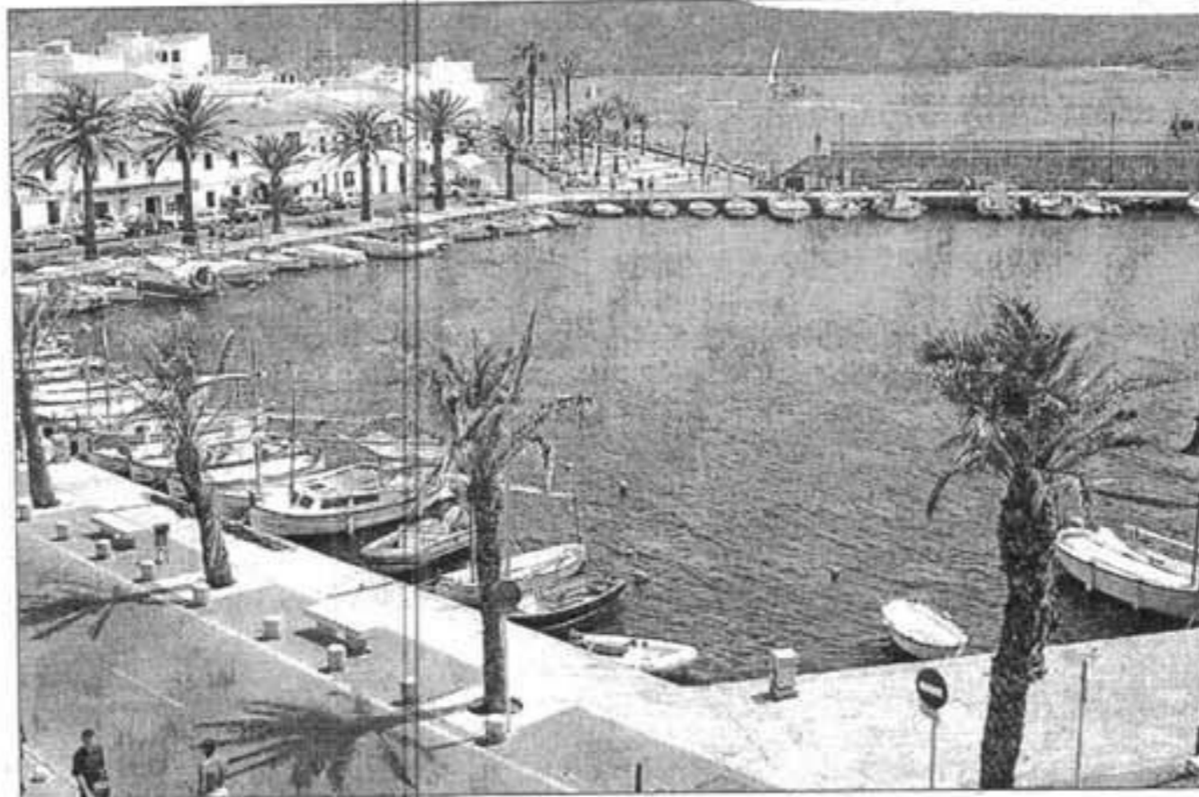
El consistorio de Es Mercadal no quiere «obras faraónicas» en el puerto de Fornells.

La reunión en la que, según el primer edil de Es Mercadal, reinó «la cordialidad», se acordó convocar un encuentro entre todas las administraciones con competencias en la bahía de Fornells (Costas, Govern, Consell y Ajuntament) para la segunda quincena de septiembre, y con el objetivo de consensuar un plan de usos para el puerto de Fornells, de cara a la más que posible ampliación de las instalaciones portuarias. Orfila agradeció «la disposición al diálogo» del nuevo responsable de Ports, «después de los problemas que hubo en el anterior