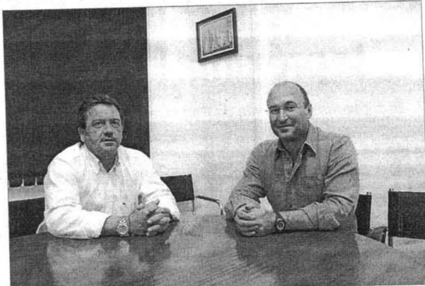
La reunión había sido solicitada por la junta directiva de la entidad.

Patiño tranquilizó al presidente de la entidad al confirmarle que, pese al cambio de gobierno, las previsiones se mantienen inalterables y no se tiene intención de modificar sensiblemente los proyectos del dique y Cala en Busquets. El vicepresidente de Ports recordó que ambas actuaciones se acometerán de forma simultánea, ya que está previsto aprovechar el material resultante