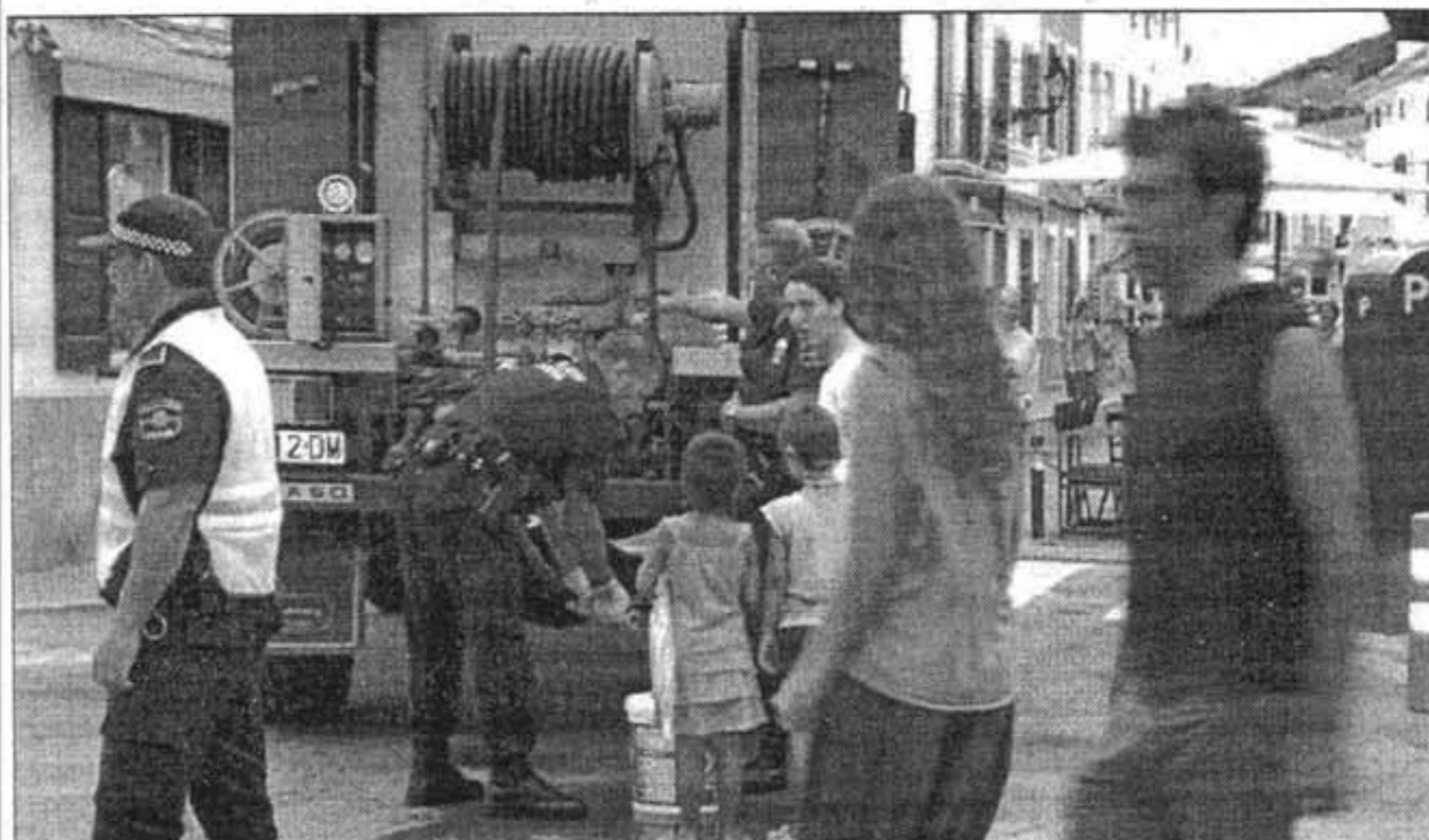
RESERVAS. Un camión de bomberos facilitó agua a los vecinos durante la tarde

Alrededor de las 13 horas la avería quedó solventada, según afirmó Orfila, aunque a partir de este momento comenzó la operación más complicada, que se prolongó a lo largo de toda la jornada. "Se había de liberar agua en pequeñas dosis para que la presión no provocara un nuevo reventón en el conducto", explicó. Por este motivo, el agua fue llegando a las viviendas de manera paulatina y con poca pre-