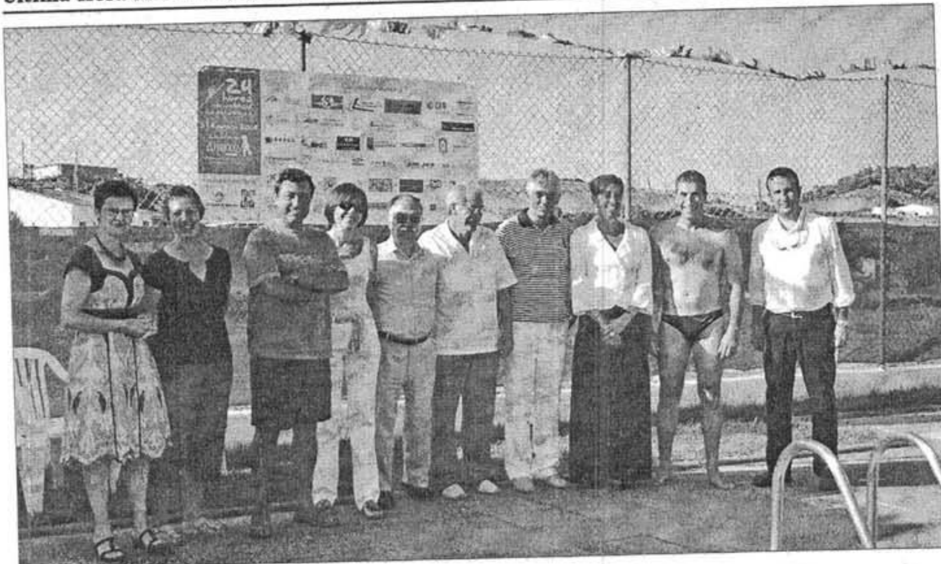
Los organizadores y las autoridades de Menorca, ayer tarde en la piscina municipal de Es Mercadal.