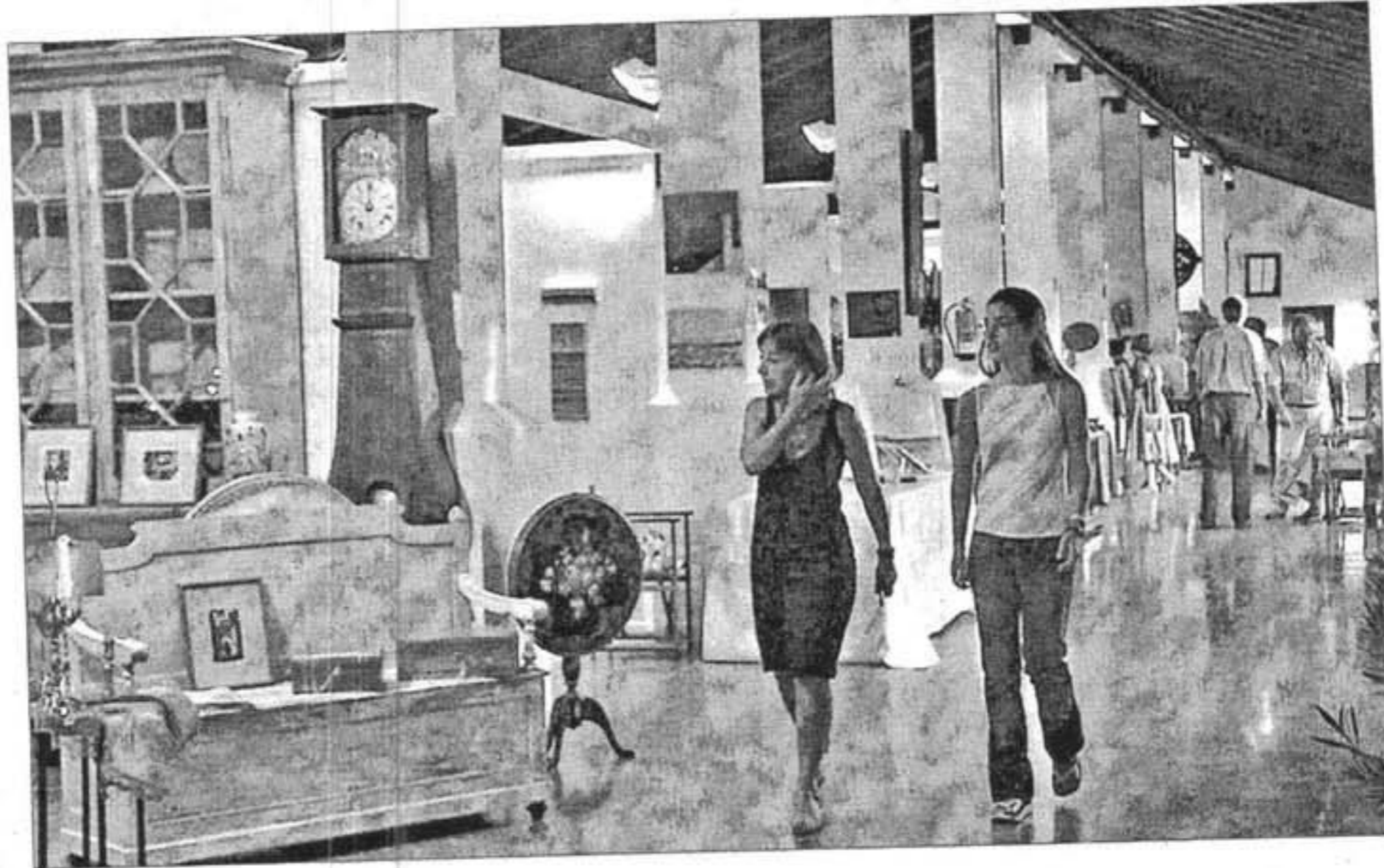
Es el tercer año que año que se celebra en Es Mercadal la Fira de Brocaners, Art i Col·leccionisme.

Mañana se inaugura en el Recinte Firal de Es Mercadal la tercera edición de la Fira de Brocaners, Art i Col·leccionisme, con doce expositores; diez de antigüedades y dos de pintura