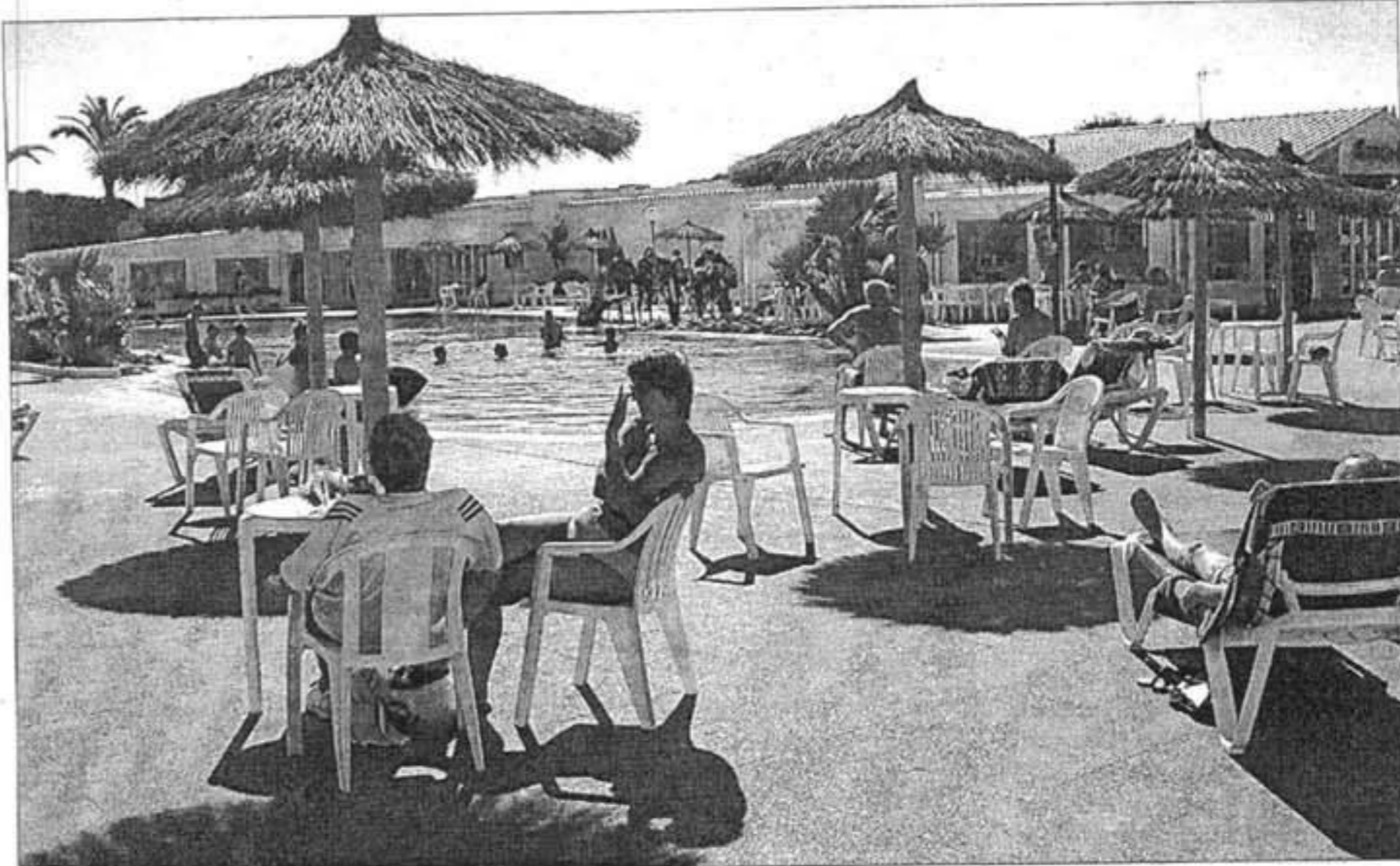
El sector hotelero de la isla valora positivamente los resultados de esta temporada turística.

No tan optimistas se muestran para el mes de octubre, y aseguran que «por ahora sólo hay entre un 13 y un 15 por ciento de las plazas reservadas».