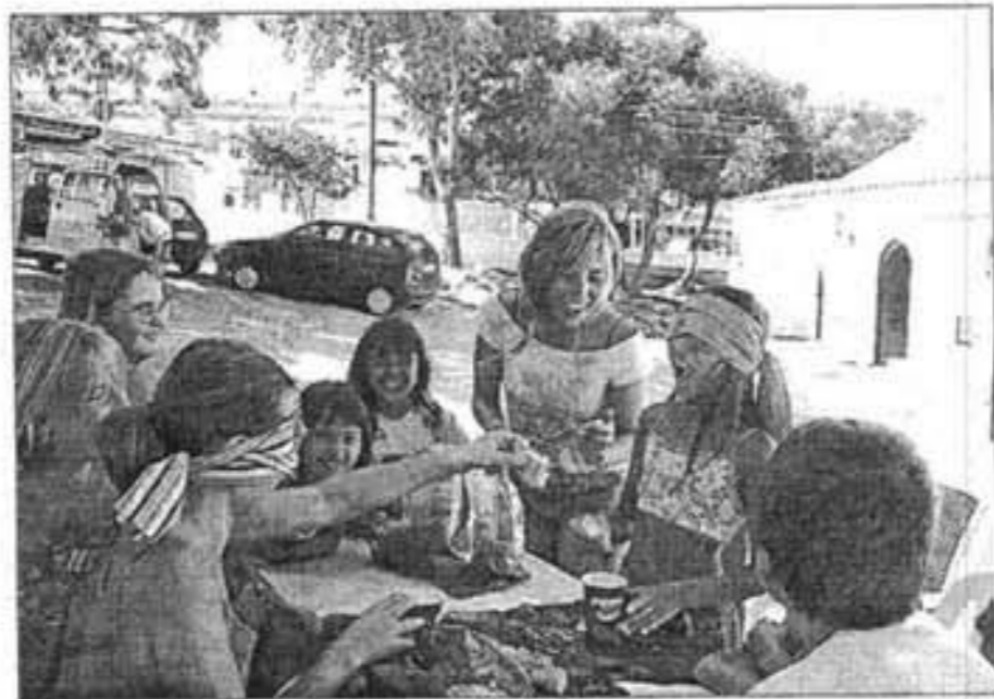
Los jóvenes mahoneses esperan la iniciativa. J. J. J. J.

Los cursos se impartirán a los profesores de educación infantil, primaria y secundaria.