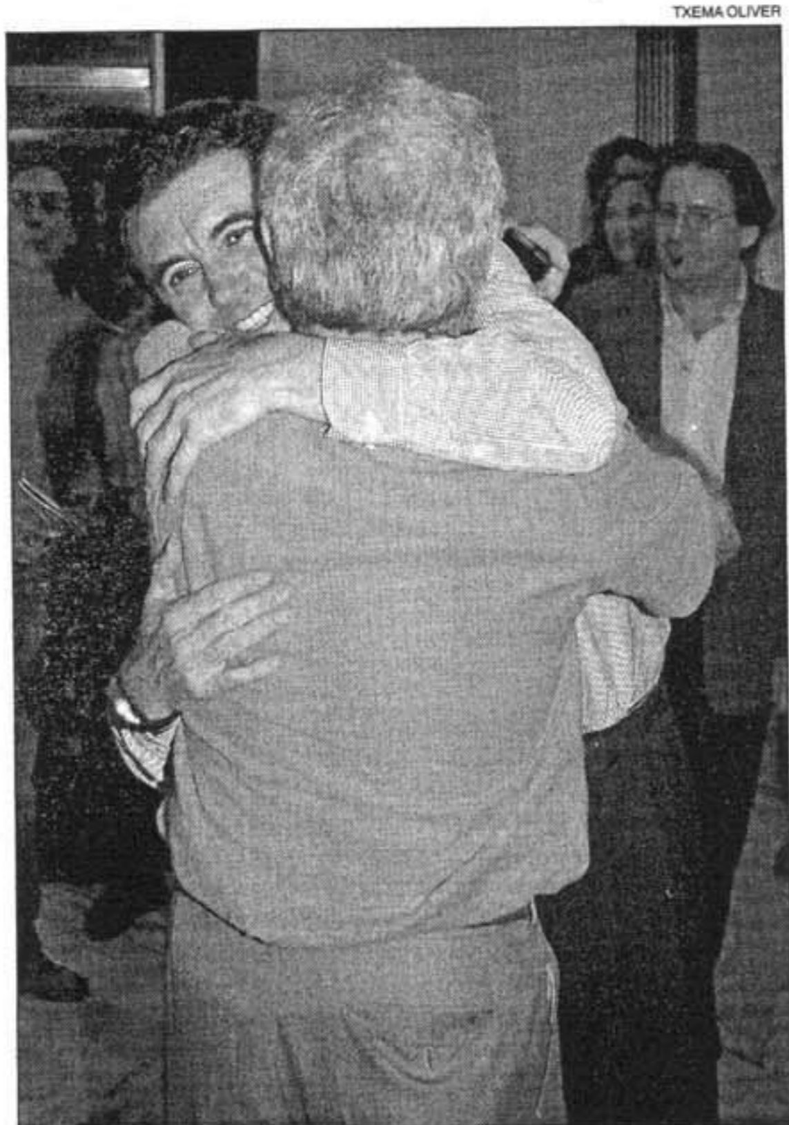
MATAS. Los resultados no le garantizan la permanencia