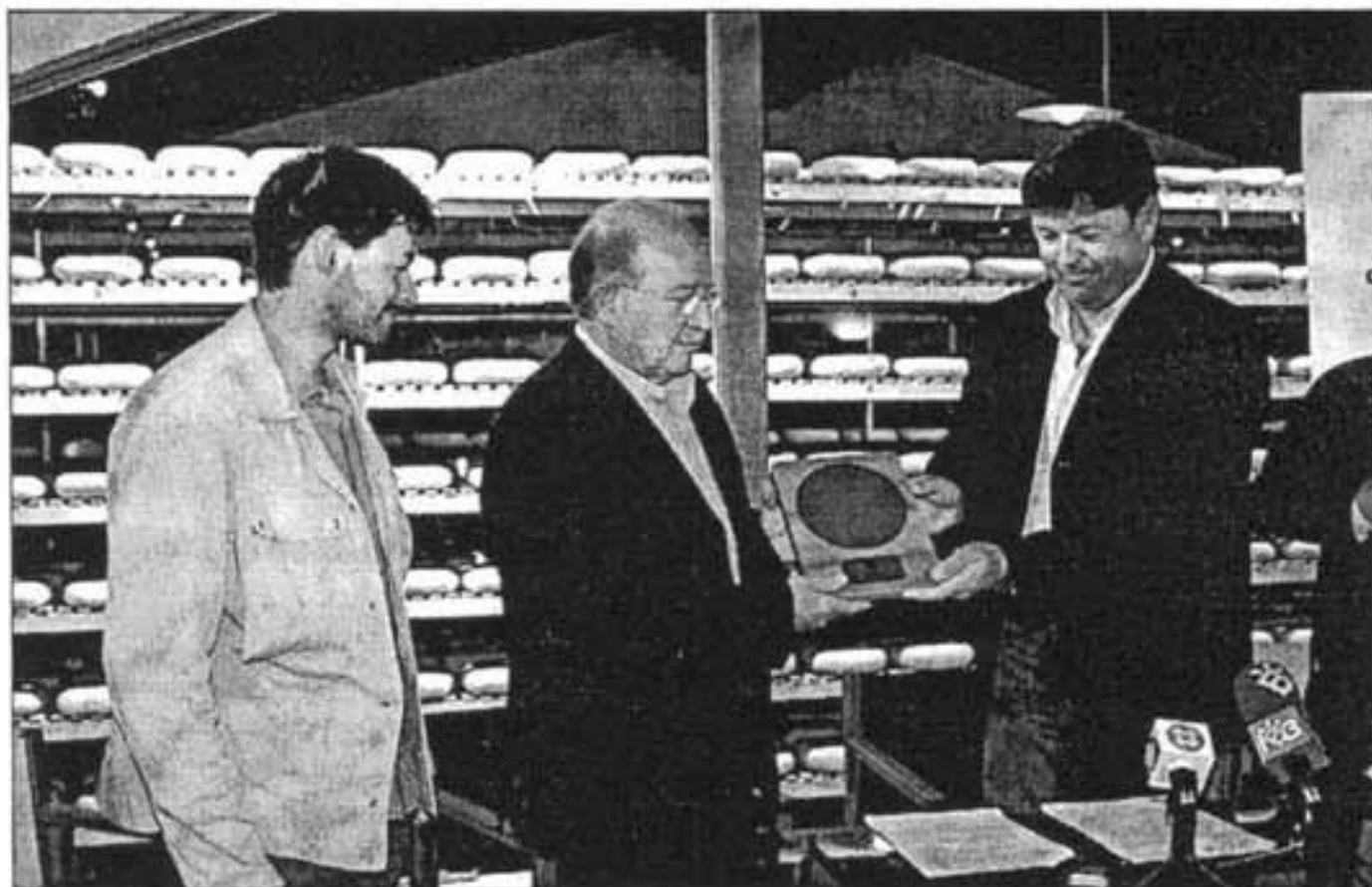
Los representantes de Hort de Sant Patrici y Xoriguer recogieron los distintivos.

agrorutas con la participación de 167 personas. También se han organizado agrorutas desde Mallorca y una combinación de charlas y excursiones con jubilados y otras asociaciones.