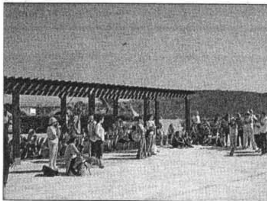
Unas 70 personas participaron en la excursión del domingo.

Reivindican un PIC que se aplique en las actuaciones tanto portuarias como de turismo náutico