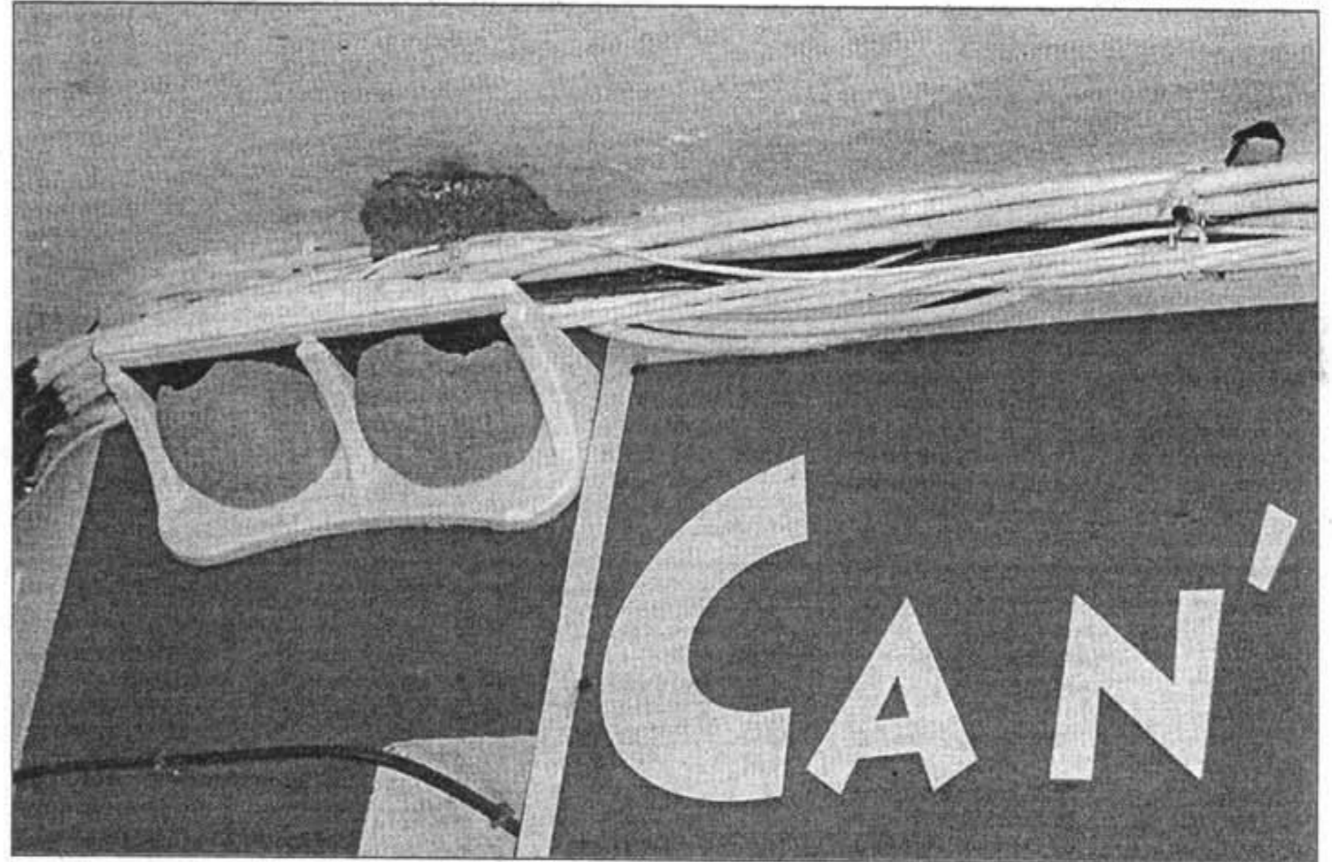
Detalle de los nidos artificiales para 'vinjolites' que sus propietarios han instalado en Ca n'Internet de Es Mercadal.

Alrededor de setenta personas participaron el pasado domingo en la que fue tercera excursión de la llamada 'ruta dels dics', que, en esta ocasión, pasó por el puerto de Fornells, donde, según los organizadores, «un proyecto público y dos proyectos privados amenazan el puerto del norte de Menorca».