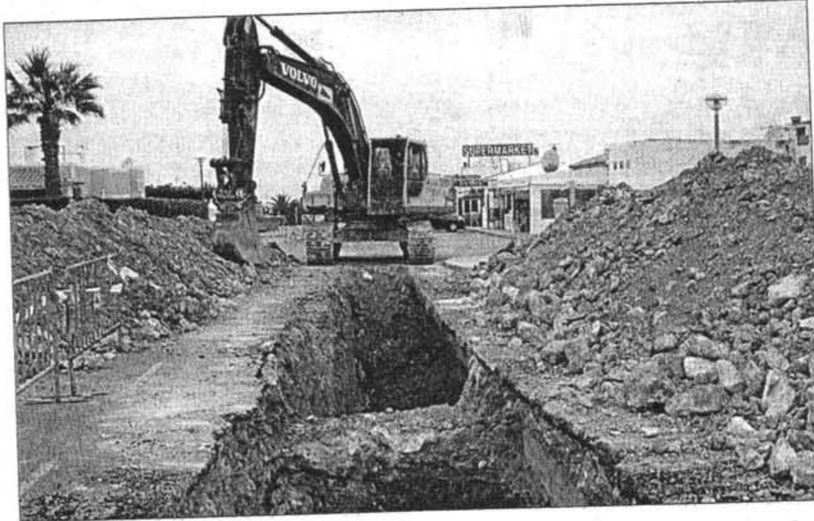
La acequia se abrió el pasado viernes, y provoca molestias en media decena de comercios de Cap d'Artrutx, en Ciutadella.

Una mejora en la red de alcantarillado provoca molestias y perjuicios económicos