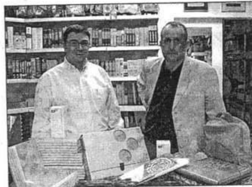
El material escolar irá a Latinoamérica.

Ante esta situación, el PSOE promete realizar «un seguimiento exhaustivo de los resultados de las actuaciones judiciales». Una actitud que no excluye otra