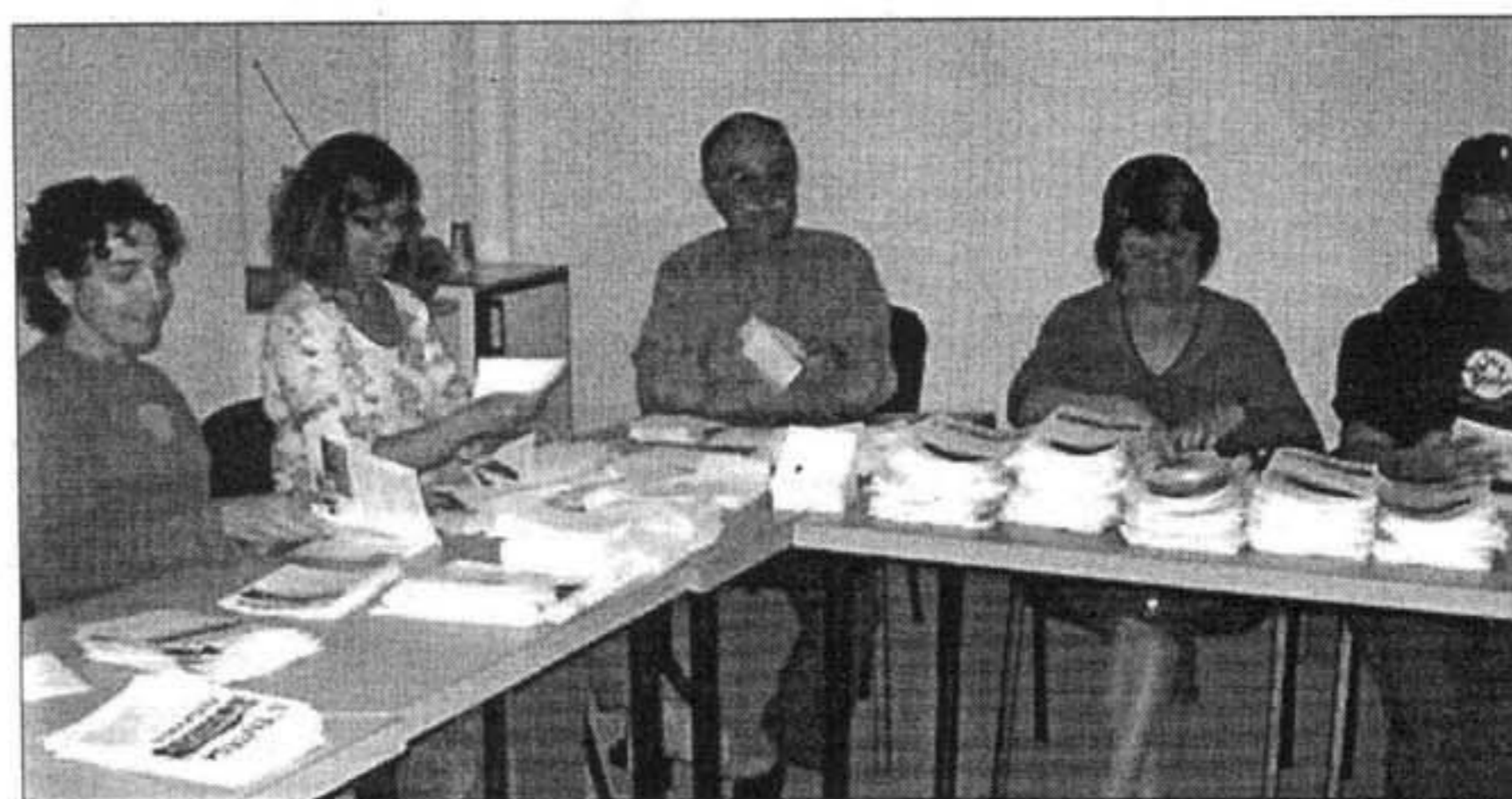
ENTESA DES MERCADAL