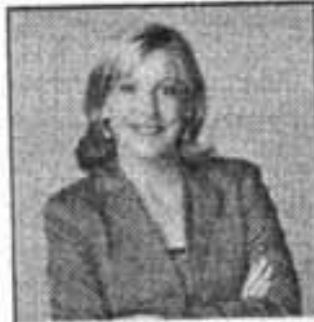
Antonia Gener, candidata del PP al Parlamento Balear