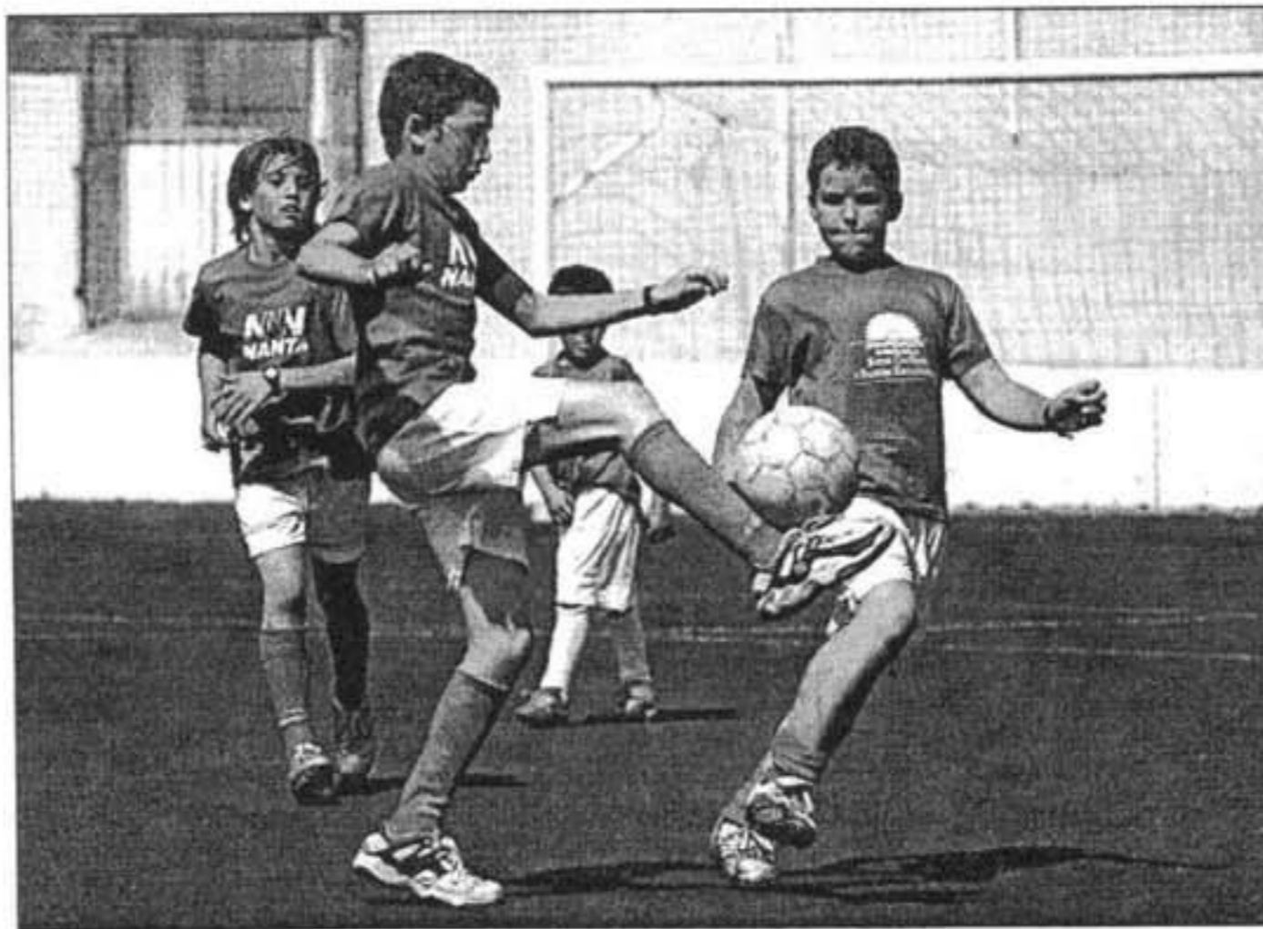
Los chavales también disfrutaron de su Sant Isidre particular.

Los veteranos abrieron la jornada con un partido que les enfrentó a los jóvenes. A la conclusión, se calzaron las botas los hijos de los propios ganaderos. Todos tuvieron premio.