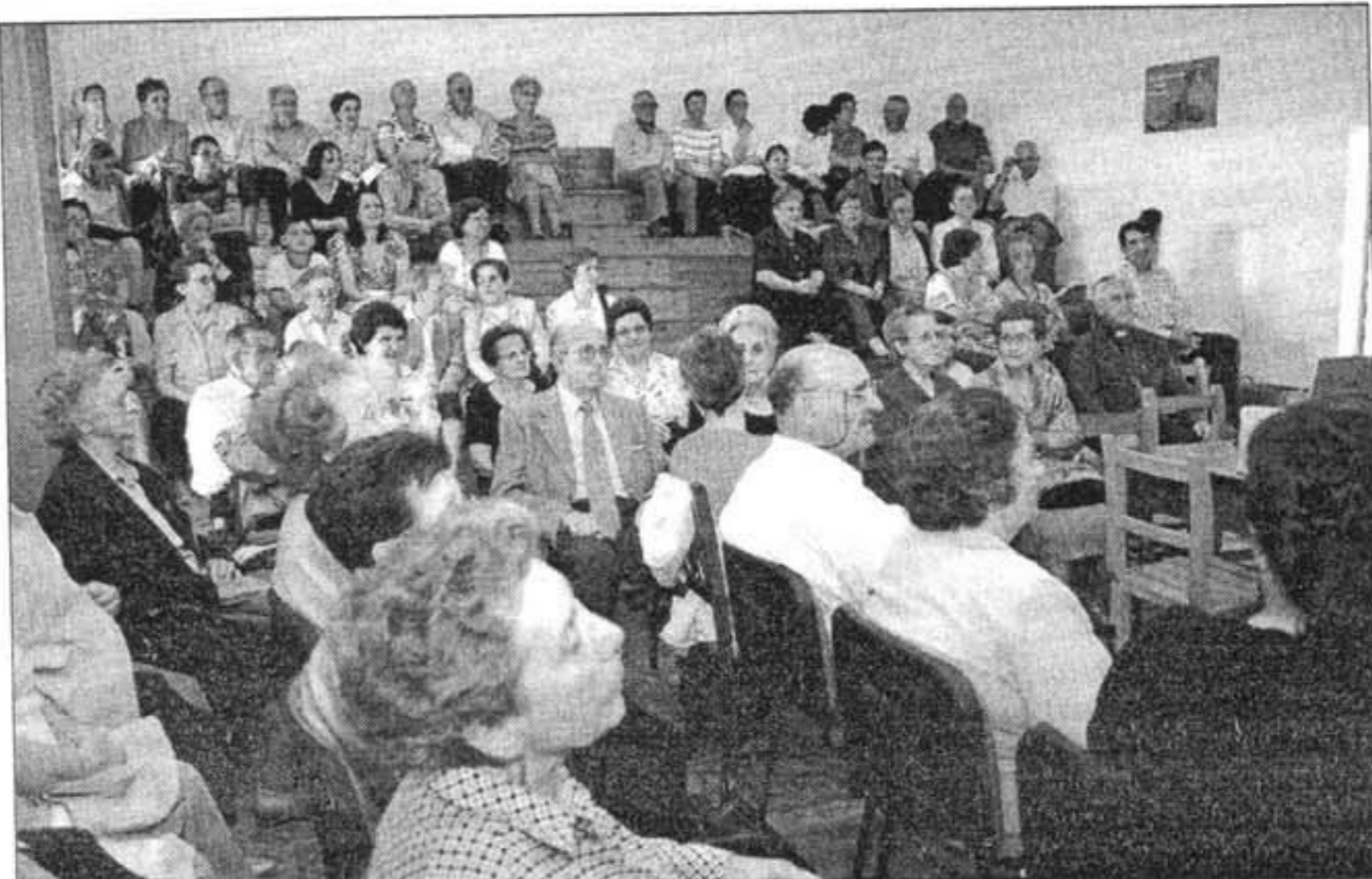
JORNADA. Amb el lema de “compartir”, va motivar una trobada al Santuari del Toro