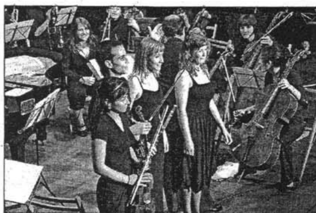
ÉXITO. Las interpretaciones fueron muy aplaudidas