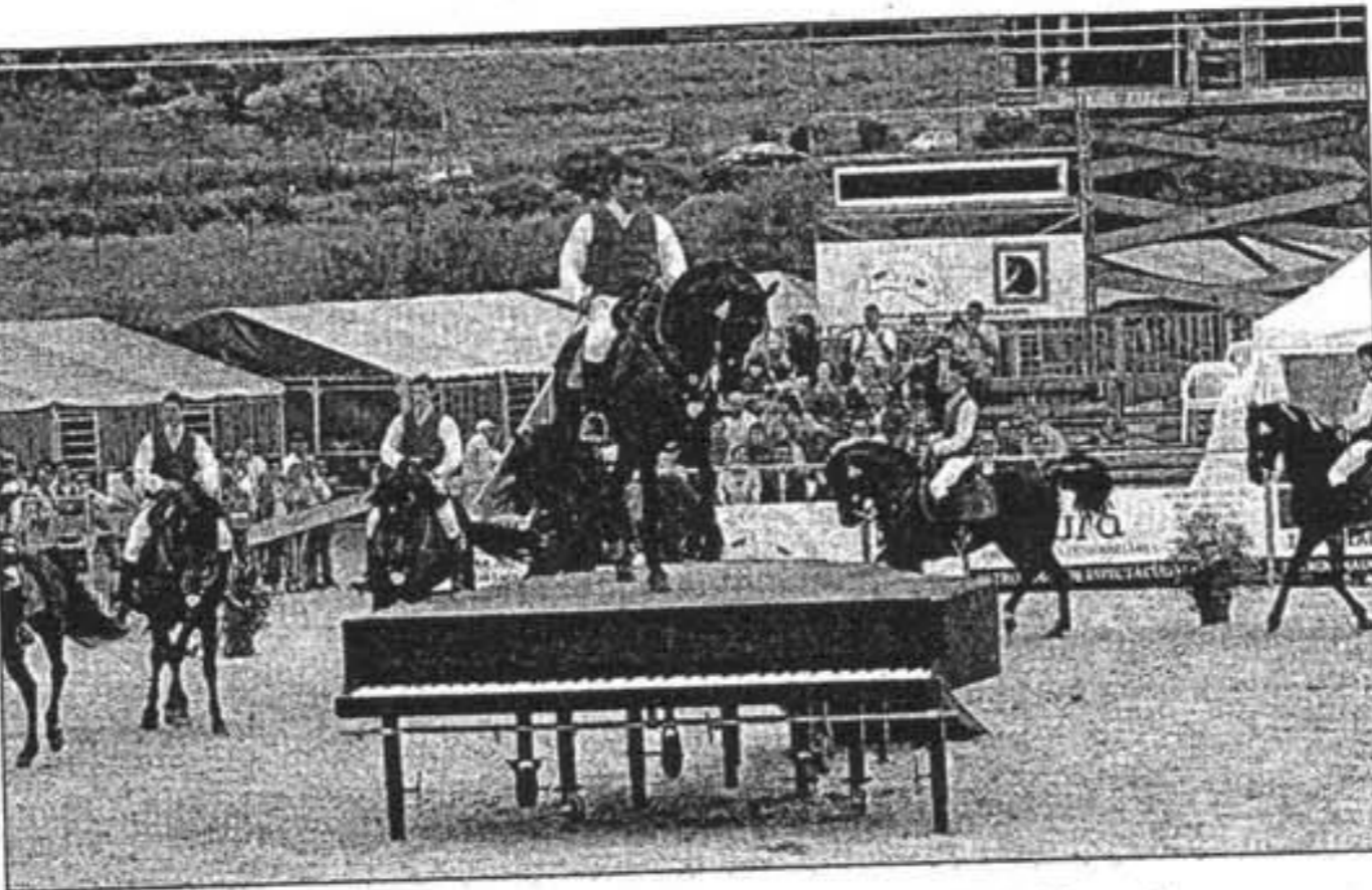
La feria se clausuró con un espectáculo de caballos al ritmo de 'Baila Morena'.

Odessa IBB y Nonte ocuparon el segundo escalafón —el de los subcampeones— en un concurso que destacó por la fuerza de sus participantes. Un año más, el recinto ferial de Es Mercadal se vio invadido por una