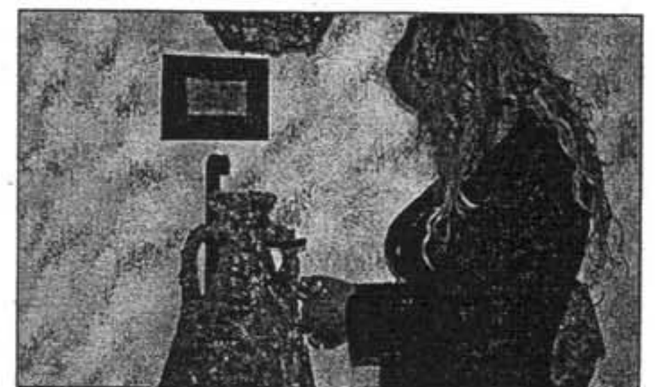
El aspecto final de cada ánfora depende de la fauna marina.

la entre los dos y tres años. Esta vida marina, en su mayoría placton microscópico, halla en estas ánforas su nido, donde crece, se desarrolla y fosiliza, lo que crea piezas únicas.