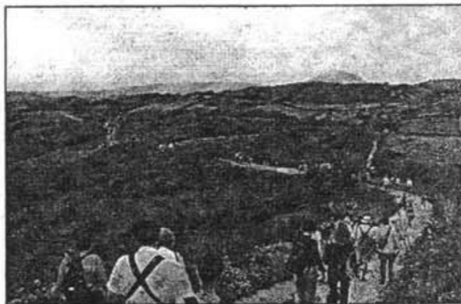
La excursión partió de Ferreries y llegó a Es Mercadal.

Según miembros del GOB, el proyecto de parque eólico de Son Bruc y Ses Comunes prevé diez kilómetros de viales