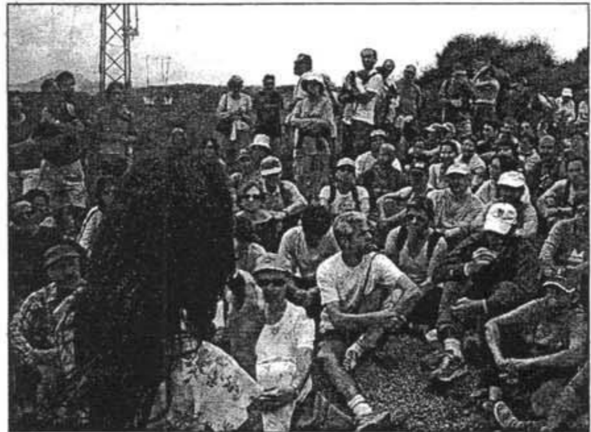
Miembros de la plataforma ciudadana que está en contra de emplazar un parque eólico en Son Bruc y Ses Comunes explicaron el proyecto.