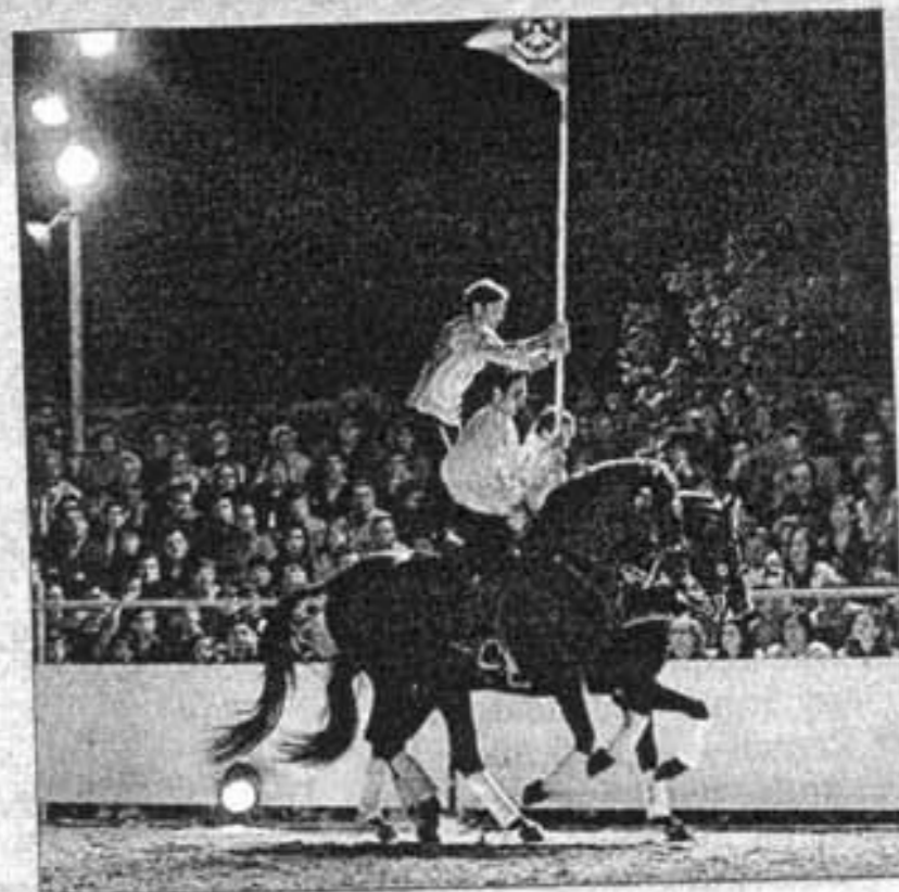
Un momento de la actuación de ayer.