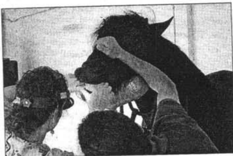
Una dentista para caballos, la sensación de la feria.

Más allá de la pista central, las actividades eran cuantiosas. Exposiciones de materiales de complemento para caballos, muestras de piezas para vestir a los animales durante las fiestas patronales, información turística, gallinas de raza